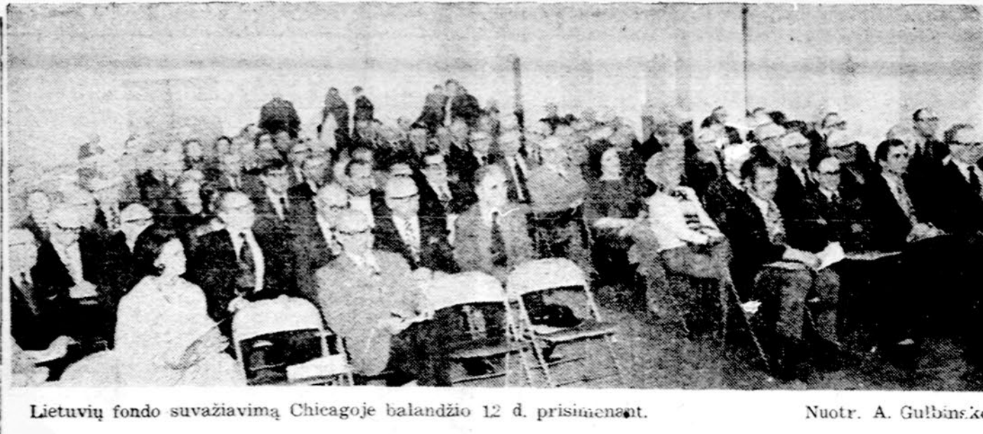
Lietuvių fondo suvažiavimą Chicagoje balandžio 12 d. prisimena.

Remiantis Balfo įstatais, direktoriui, negalindiam eiti pareigų ar mirus, jo vieton direktorių išrenka direktorių suva-