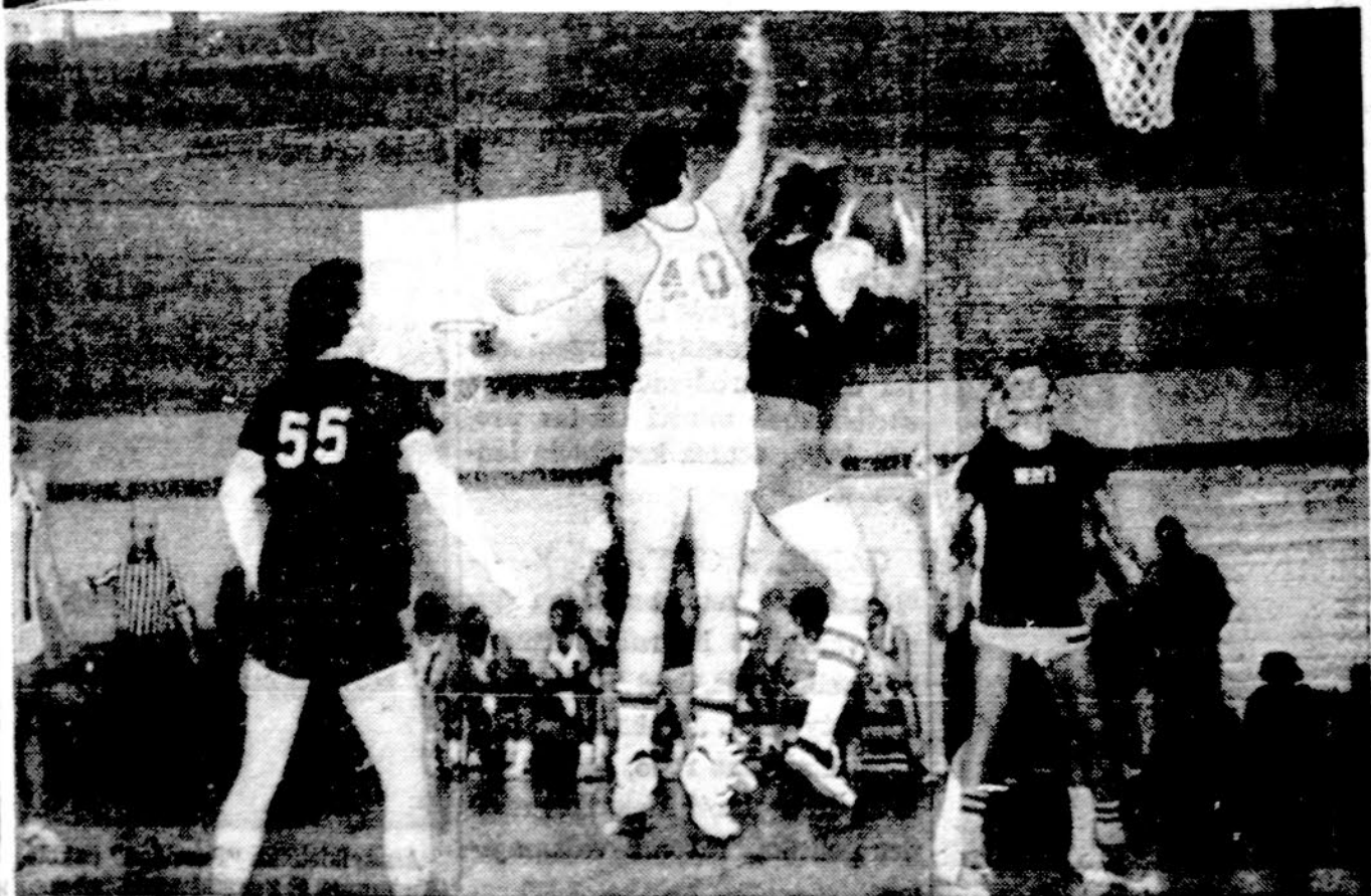
Momentas iš krepšinio baigminių rungtynių.

Chicago Lituaniškos pirmoji futbolo komanda perėta sekma-dinį pasiekė maloniai staigmena, nugalėdami Wislos komandą 1-0. Ši komanda per paskutinius du metus buvo pralaimėjusi nei vienerių rungtynių. Įvartį įmušė dr. J. Ringus. Sekantį sekmadienį 3 val. p.p. Marquette Parko aikštėje rungtynės prieš stiprią Peorijos koman-dą. Prieš tai 12 val., rezervo rungtynės prieš M-ayaf. Jauniai vykstą ir Berwin Mor-ton West aikštėje prieš Spartą, o jaunučiai į Buffalo Grove, prieš Schwaben. Ir pagaliau ma-žinkai šeštadienį 2 val. p.p. žais Marquette Parko aikštėje. (Nukolta į 8 pusl.)