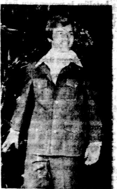
POILSIO KOSTIUMAS (Leisure suit)

Pasiruoškite atostogoms ir aplankykite SEIGAN'S parduotuvę tuojau pat, kol yra didesnis pasirinkimas pavasarinii ir vasariniii rūbų. Pirke kostiumą ar sportinį švarką vyrams ar berniukams —