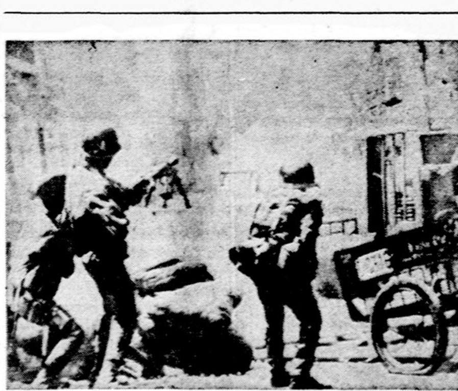
Šiaurės Vietnamo kariai vieno užimto miesto gatvėse, kai pietų vietnamiečiai dar gynėsi

Ky buvo lėktuvneš, USS Blue Ridge. Filipinų teritorijoje Ky išbuvo tik 10 minučių, iki buvo perkeltas į lėktuvą ir nuskraidintas į Guam. Tokiu būdu buvo išvengta konflikto su Filipinais, kurie norėjo Ky ir kitus buvusius Pietų Vietnamo oficialius pareigūnus suimti.