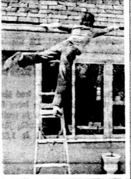
Pavasaris — nelaimingų atsitikimų laikotarpis. Amerikoje kasmet 50, 000 žmonių susižeidžia save, netei- singu būdu naudodami žolei pianti motorines mašines. Reikia atsar- giai naudoti ir kopėčias. Visada jas apaejoj turi kas nors prižiūrėti. Vaikai neturi kopėčiomis laiptoti. 183.000 nelaimių kasmet įvyksta, kai žmonės susižeidžia į stiklines duris bei langus

Mediciniški laimėjimai gali būti žmogui naudingai pritaikyti tik tada, kai neišskiriamai bus gerinamos socialinės — ekonomiš- nės gyvenimo sąlygos. Taip pat įkandin turi eiti žmogaus elges- io gerinimas. Jau praėjo tie lai- kai, kad mes rūpinomės vien pra- ilginiu žmogaus gyvenimu. Ma- tom dabar nelaimingiausias ilgai gyvenančius, visų apleistus mi- siškius ir kitataučius. Tai bausis jaunesniųjų elgesys — pagyve- nusiuoju apleidimas. Toliau taip tęstis negali, jei mūmyste liko nors dulkelė žmoniškumo. Tad visi prie reikiamų darbų, kiekvie- nas savoje srityje. Rūpinkimės ne vien dainuojančiais ir šokančiais, bet ir žymn linkstančiais tautie- čiais. Jiems reikia sudaryti pa- kenčiamas jų senatvės dienosę gyvenimo sąlygas kuriant kad ir specialias lietuviškas sodybas. Jo se širdis vyraus, jose niekas ne- girtaus, nesismalins ir negarga- liuos — vien lietuviškai vienas su kitu savo vargais — džiaus- mais dalinsis. Pasiskaityti. Me- dical Tribune, Vol. 16, No. 17 May 7, 1975.