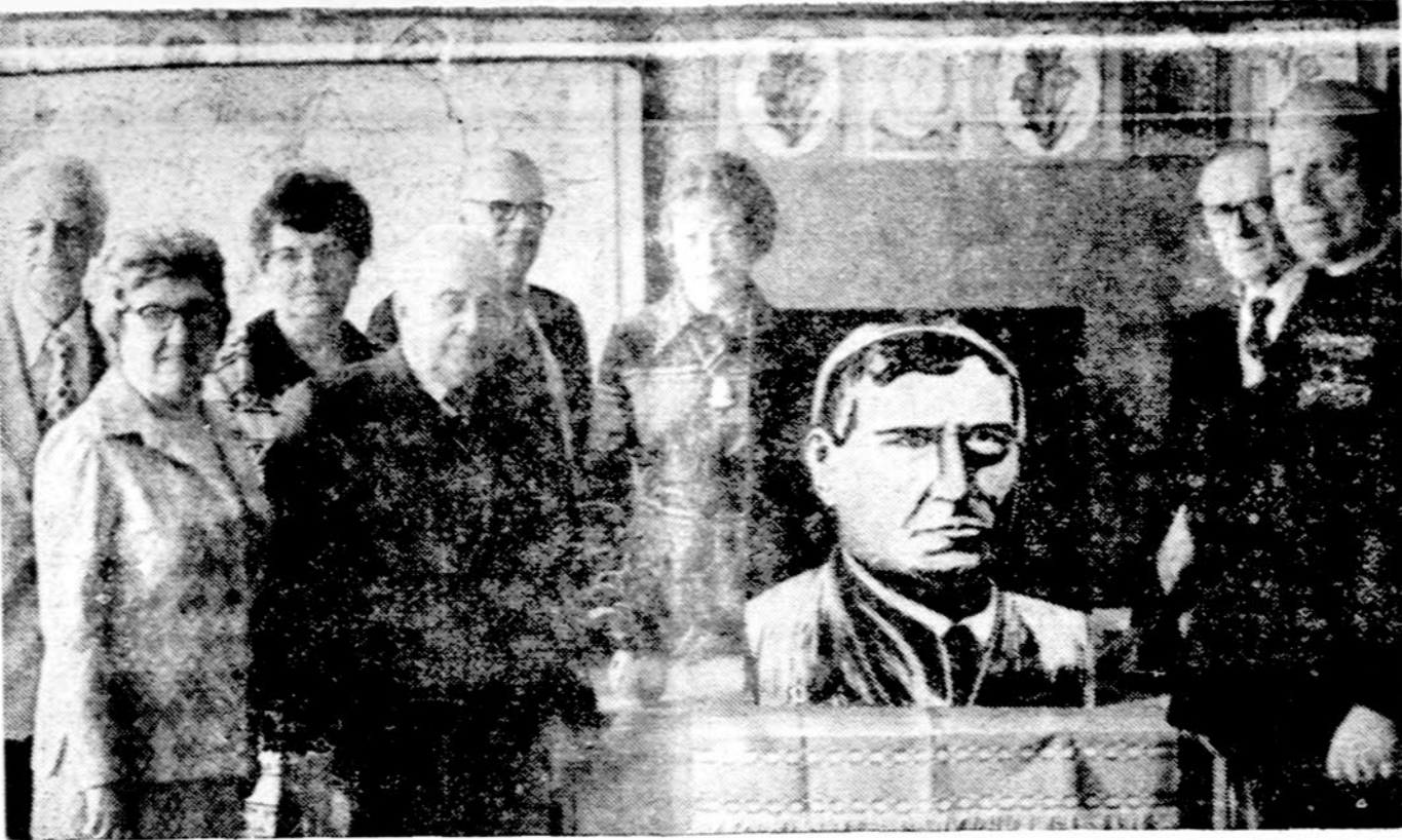
Cicero Aukšt. lit. mokyklos vysk. M. Valančiaus minėjime. Š. m. balandžio mėn. 19 d., mokytojai ir Pedagoginio lit. instituto, neakivaizdinio skyriaus direktorius.