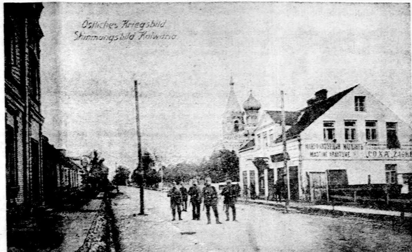
Prieš 60 metų. Suvalkų Kalvarija 1915 metais, I pasaulinio karo metu. Vokiečių kareiviai patuliuoja gatvėse, bet rusiškieji užrašai prie krautuvių dar nebuvo pakeisti

“Dear Senator Sparkman: I wish to express my strongest support of the Senate Concurrent Resolution No 29 submitted to the Senate by Senator Carl T. Curtis. I hope that you will support this important Resolution”.