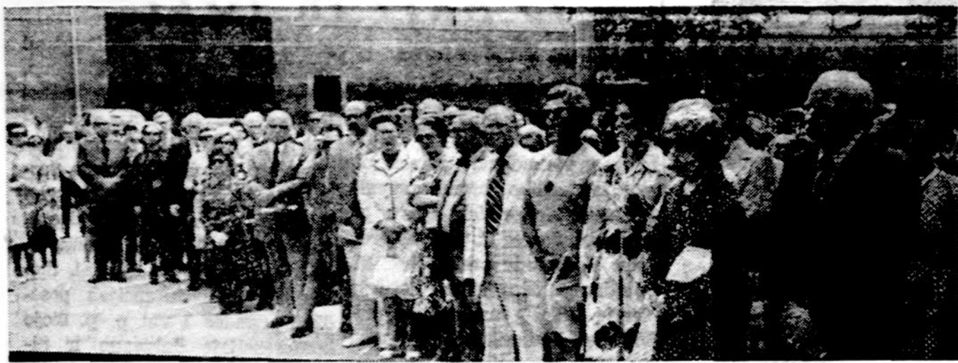
Iš Lietuvos gydytojų suvažiavimo Chicagoje. Gydytojai pa gerbia žuvusius Jaunimo centro sodelyje.