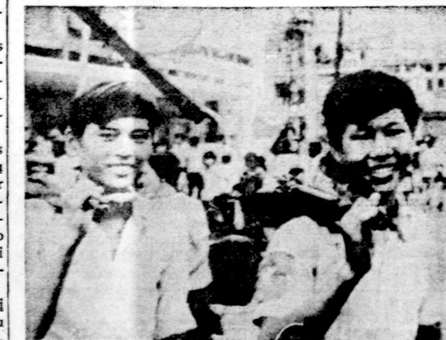
Jaunieji Vietkongo kariai Saigone

SAIGONAS. — Amerikietis žurnalistas Matt Franjola, dirbęs AP agentūrai, buvo pirmas, kurį naujoji valdžia išvarė. Korrespondentas savo įstaigai žinias teikė tokias, kokios yra, o ne kokių reikalauja komunistai.