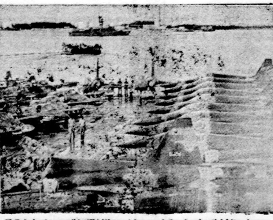
Iš Tajo bazių amerikietiški lėktuvai jau pradeda gribenti į kitas bazes.

KAMPALA. — Ugandos diktatorius Idi Amin yra žinomas kaip didelis Hitlerio garbintojas, tačiau vis vien gauna paramą ir iš Maskvos. Kazin, kaip ten bus toliau su ta Maskvos malone, jei jis įvykdys savo planą — pastatys savo valstybėje Hitlerio paminklą. Jis dar žada ir savo valstybėje pietryčių teritorijos dalį pavadinti šio fiurerio vardu, rašo "Newsweek". Apie 100 mylių nuo tos vietos, dahar Tanzanijos valstybėje, I pasaulinio karo metu įvyko smarkus mūšis tarp volkečių armijos, vadovaujamos gen. Paul von Lettow - Vorbeck ir aliantų, vadovaujant gen. Jan Smuts.