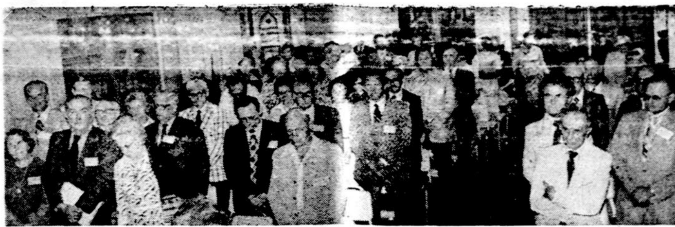
Pasaulio lietuvių gydytojų sąjungos suvažiavimas Chicagoje įvyko gegužės 23-24 d. Chicagoje Sheraton viešbutyje.

— Kiekvienas žmogus susideda iš tos pačios sielos, raumėnų, kaulų ir piėtų. Tik pietuose yra daug skirtumų.