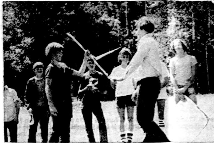
Linksmas bendravimas berniukų stovykloje Neringoje nuo birželio 29 iki liepos 12.