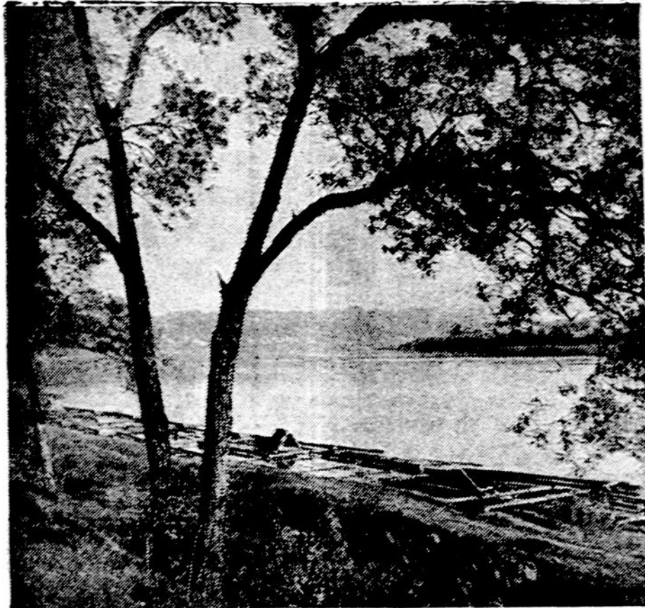
Sieliai Nemune prie Aukštosios Panemunės krantų, Kauno priemiesty