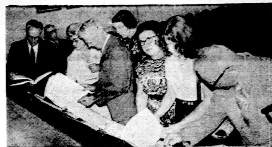
Situvos koplyčios Washingtono ir Lietuvos Kankinių koplyčios Vatikane aukotojai apžiūri aukotojų knygas gegužės 25 d. Jaunimo centre.

— Aš galiu, žinoma, vėl įsidarbinti krovėju. Galu dirbti gamykloje tekintoju arba suvirintoju. Bet dekanas reikalauja, kad rasčiau kurybinį darbą, kad būčiau mokslinių - techninių darbuotojų kastoje.