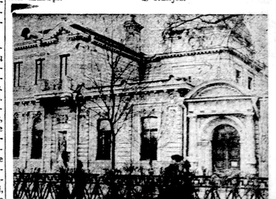
Vakarų Vokietijos ambasada Maskvoje. Dažnas atsitikimas, kad sovietų milicija neleidžia visiems į ją įeiti, tai vokiečiai, norj emigruoti, gatvėje surengia demonstracijas ir tokiu būdu viduj esančių valdininkų atkreipia dėmesį

NEW YORK. — Brazilijos futbolo (soccer) žvaigždė Pele (Edson Arandes), apsisprendė už New Yorką. Iš brazilų rinktinės jis išeina "laikiniai", ir priima pasiūlymą žaisti už New Yorko Cosmos. Reikia manyti, kad nuo šiol ir šia sporto šaka Amerikoj susidomėjimas smarkiai pakils. Pasirašo trejų metų kontraktą ir gaus 7 mil. dolerių. Joks sportininkas iki šiol nėra tiek uždirbęs.