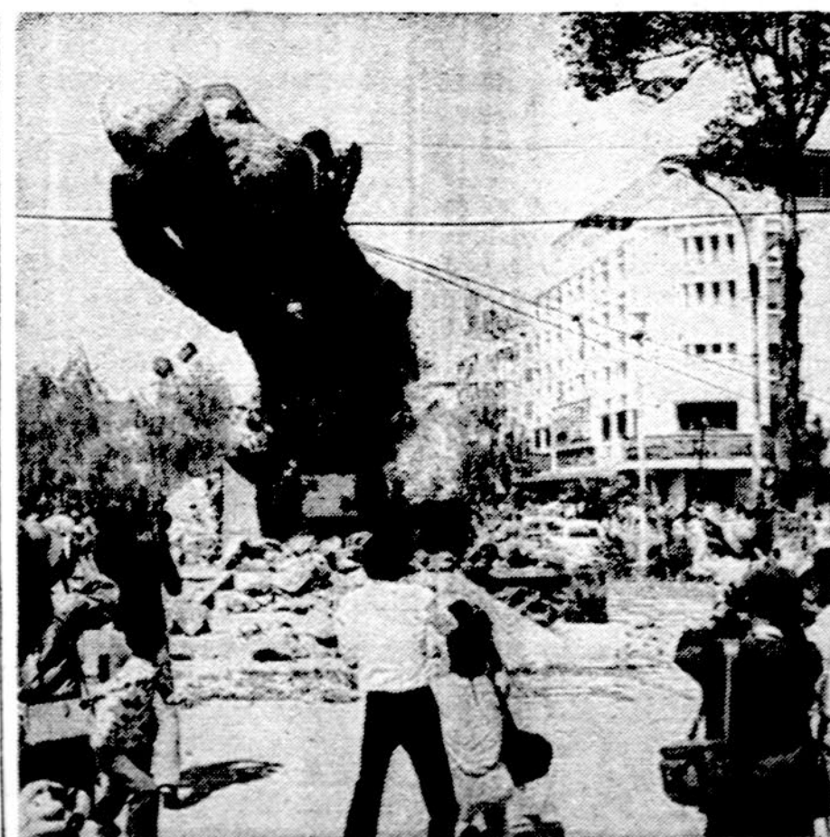
Saigono centre iš senų laikų stovėjo Nežinomo kareivio paminklas, prie jo būdavo dedamos gėlės. Dabar komunistai šį paminklą nugriovė. Griovimo momentą užfiksavo vokiečių politikos žurnalo "Der Spiegel" reporteris Boeris Gallasch.

Paaikškėjo ir apie socialistų vadų ultimatumą karinei juntai. Jeigu iki šios savaitės pabaigos socialistams nebus gražintas "Republica" laikraštis, jie pasitraukia iš vyriausybės darbų. Ultimatumą buvo įteikė praėjusios savaitės pasitarimų metu ir buvo laikoma paslapyt. Socialistai nežada daryti jokių kompromisų.