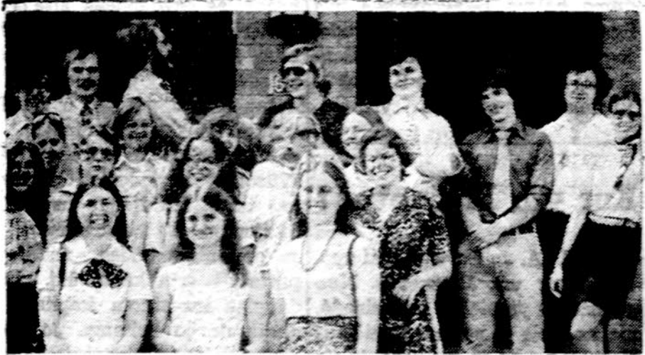
Dalis Chicago studentų ateitininkų po šv. Mišių prie Tėvų marijonų koplyčios.