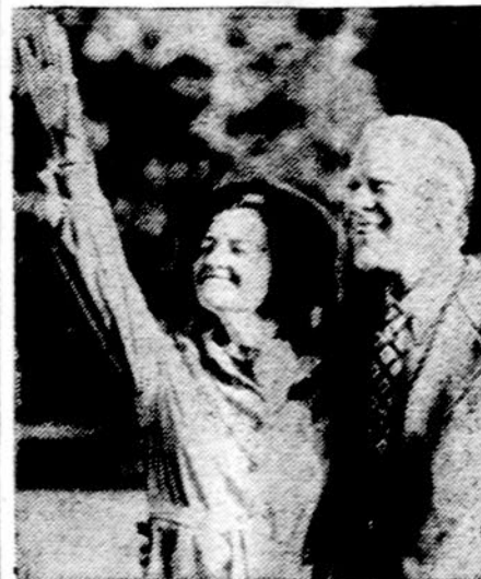
Prezidentas Gerald Fordas su savo žmona Betty, kuri vis labiau įsijungia į Amerikos visuomeninį gyvenimą.

Šios politikos uždavinys spartinti suvartojimą, sumažinti prekių atsargą ir skatinti pramonę.