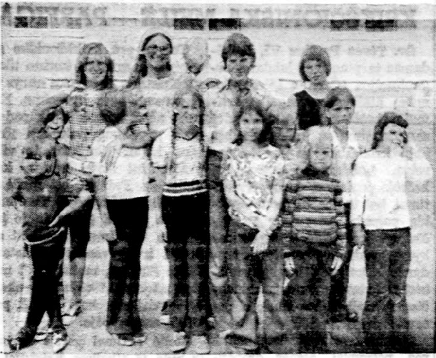
Jaučiausias stovyklautojos mergaičių stovykloje kartu su pagalbininkėmis.