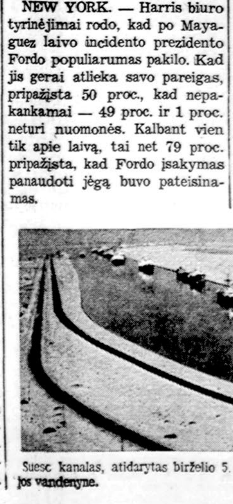
Sueso kanalas, atidarytas birželio 5. Daugiausia naudos iš to turės sovietai, galį ap rūpinti savo karo laivus Indijos vandenynė.

HONG KONG. — Iš Saigono išsvaryti laikraštiniškai teigia, kad, jų žiniomis, bent 64 amerikiečiai liko Pietų Vietname. Liko ir apie 600 vietnamiečių, tarnavusių Amerikos įstaigose Vietname, nespėjusių pasitraukti.