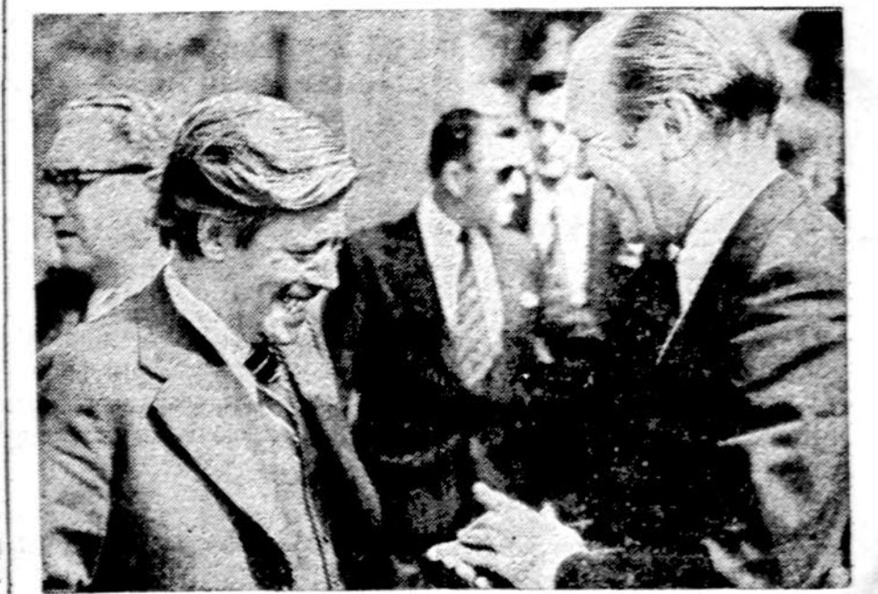
V. Vokietijos kancleris Helmut Schmidt ir prezidentas Gerald Ford Briuselyje NATO konferencijos metu

Ministeris pirmininkas Harold Wilsonas, ragindamas už Rinką, teigė, kad įsijungus į 250 milijonų ūkinę bendruomenę, yra geriausias būdas ant kojų pastatyti smunkantį ūkį, bus daugiau investuota kapitalo ir duota darbo britams. Jo oponentai sakė priešingai — bedarbių padaugės nuo 500,000 iki 750,000 ir pakils maisto kainos.