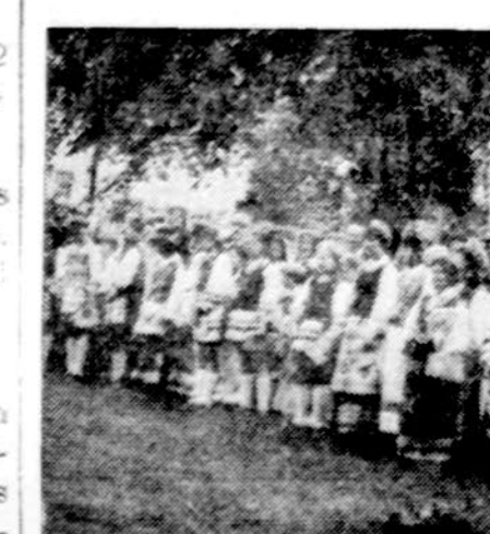
Brighton Parko lietuvinės mokyklos mokiniai meldžiasi lietuvių Šv. Kazimiero kapinėse Chicagoje.

× Vlodo Jakubėno fortepiono studijos mokinių reitalis įvyksta Jaunimo centro didžiojoje salėje šį penktadienį, birželio mėn. 13 d., 7:30 val. vakaro. Dalyvaus 20 mokinių, jų tarpe nemažai pažengusių. Po koncerto ten pat salėje mokinių tėvai rengia arbatėlę. (pr.)