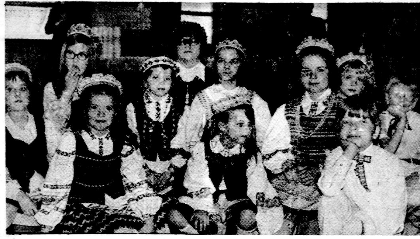
Cicero, Ill., jaunimas, atlikęs programą motinos dienos minėjime Šv. Antano parapijos salėje.