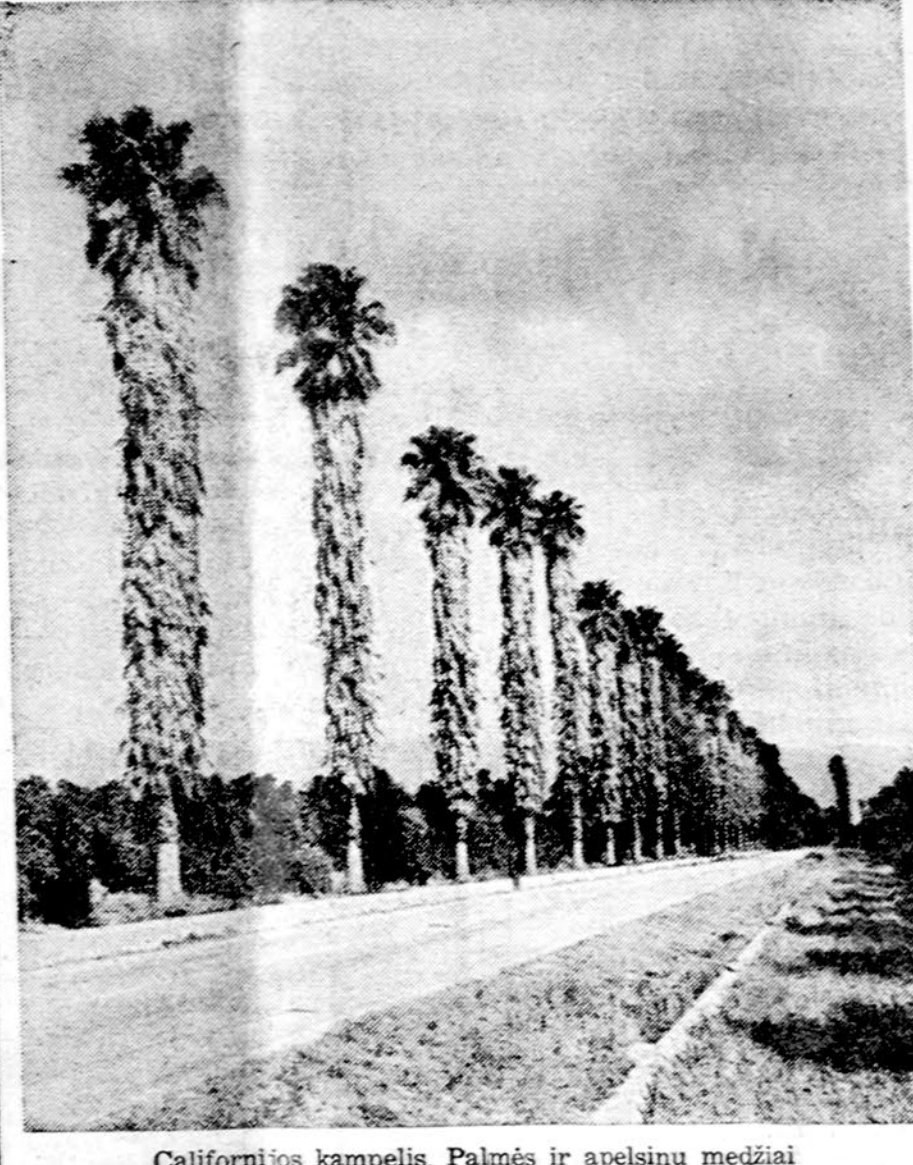
Californijos kempelis. Palmės ir apelsinų medžiai

mokslo metais ateistinių žinių propaganda moksleivių ir jų tėvų tarpe kaip ir anksčiau yra vienas iš svarbiausių mokyklos uždavinių... Ryšium su tuo, kad praėjusiais 1973-74 m.m. rajono mokyklos padarė labai mažai ekskursijų i Vilniaus ateistinį muziejų, Jus ipareigojame i tai atkreipti klasių vadovų dėmesį ir 1974-75 m.m. suorganizuoti Jūsų mokyklos visus mokinius, kad jie aplankytų ateistinį muziejų."