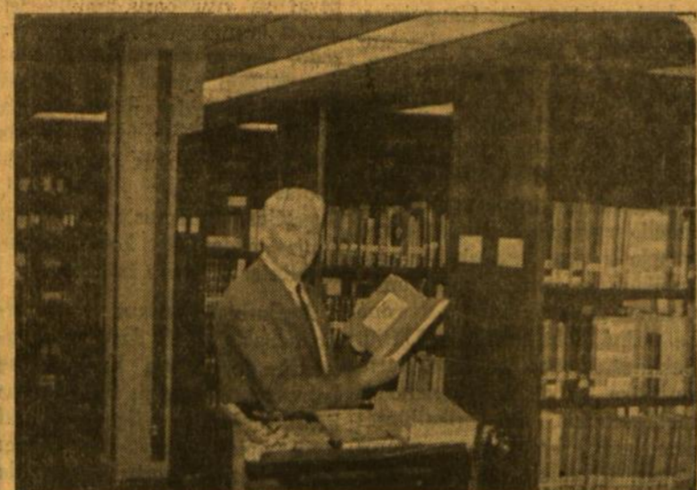
Gamtos grožinės literatūros skyrius "J. Kuprionis Arboretum Collection" vardu Louisianos universiteto bibliotekoje. Į kiekvieną knygą įdedama jo vardu etiketė.

Universitetas iš savo pusės paskyrė kitą tokią pat sumą, sudarydamas fondą specialiai šios