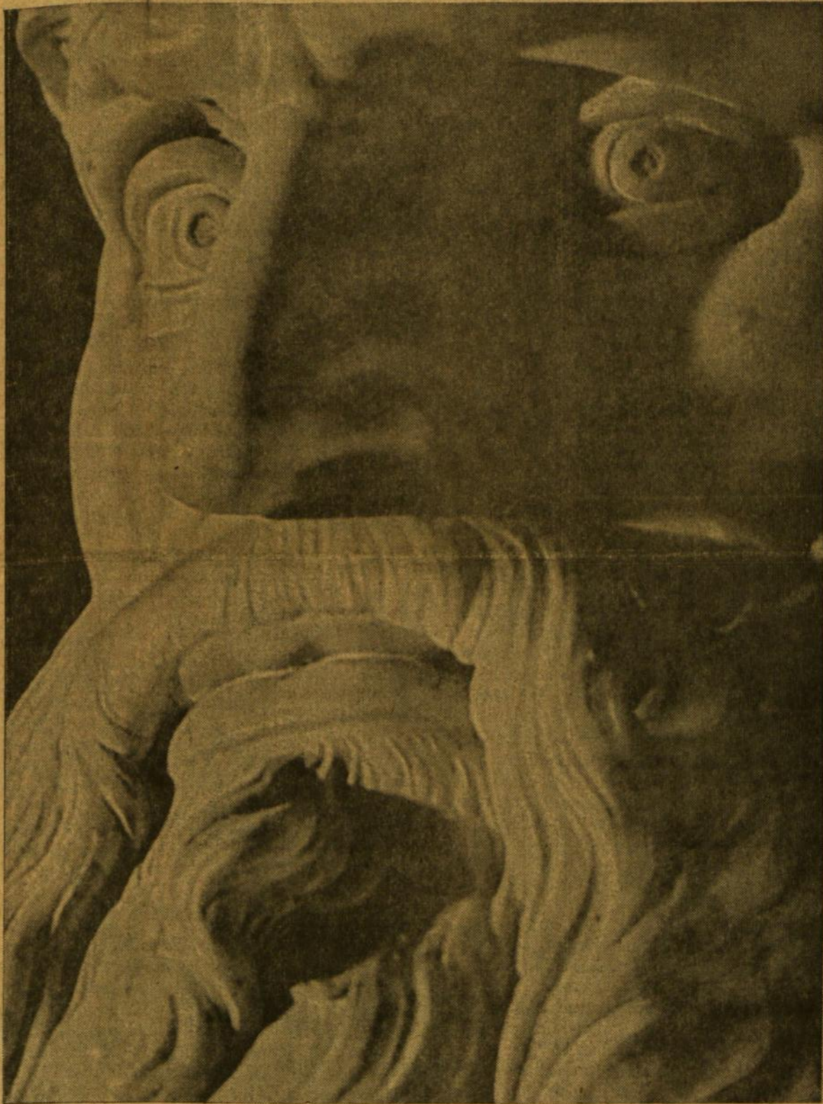
Mozė (skulptūros veido detalė, marmuras)

Michelangelo, vykdydamas pop. Julijaus norą, pristatė po-piežiui kapo paminklo projektą. Tai turėjo būti didingas pamink-las, apsuptas daugybės statulų. Popiežiui projektas patiko ir pa-siuntė Michelangelo į Kararos kalnus pasirinkti reikiamų mar-murų. Atrodo viskas eina sklan-džiai. Bet kai Michelangelo grį-žo į Romą, rado popiežiaus rū-mų duris jam uždarytas; sargybi-niai jo neleidė. Kas atsitiko? Mi-chelangelo įtarė, kad pop. Juli-jui (jau buvo amžiumi senas) Bramantė išaiškines, jog staty-