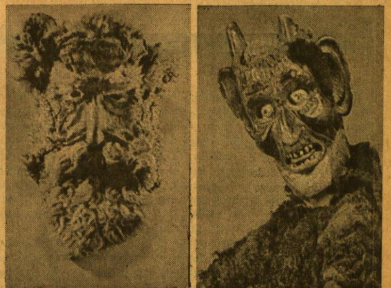
Lietuvių liaudies menas — kaukės

Itin džiugina — tiek literatūrine, tiek tautine bei žmogiškąja prasme — R. Lankausko herojaus polinkis vesti drąsų dialogą su savimi, kartais klausiti esminių etikos klausimų: „Kur einame? Kur einu aš“. Ir tuoj žmogiškai prisipažinti: „Niekas