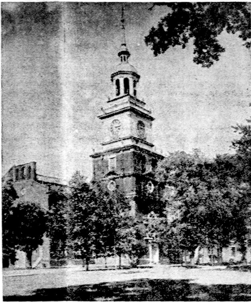
Independence Hall Philadelphia, kur prieš 199 metus buvo pasirašyta Jungtinių Amerikos Valstijų nepriklausomybė.