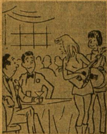
Jaunimas dėkoja tėvams, už nebusias kovas.

Taigi malonu, kad mūsų jaunimas pralinkšminamas. Jaunimas įvertina savo tėvus, kurie anais laikais tik todėl nekojo, kad, laimėję prieš ruskius, nebūtų patekę į Ameriką. Jeigu tėvai kovoja dabar, tai todėl, kad