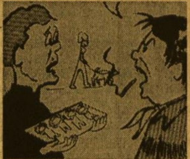
Medaluoti ir nemedaluoti šių laikų kovotojai.

Knygose mes skaitome, kad drambliai gyvena ilgiau už žmones. Greičiausiai dėl to, kad jie niekada nesirūpina apie bandymą numesti svorį. "Reader's Digest", 1975 m. birž.