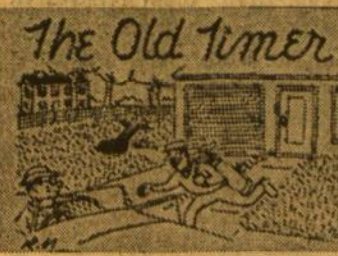
Nėra jokio džiaugsmo neturėti ką veikti, bet yra džiaugsmas turėti daug ką dirbti ir tačiau išvengti to darbo.

Prie ko prilips — ar prie auluko, ar prie tavo gamintojų bėdynės — ne taip jau svarbu. Tegū nors vienoje vietoje pagaliau prilimpa. Tai bus pirmasis poslinkis tavo reabilitacijos linkme".