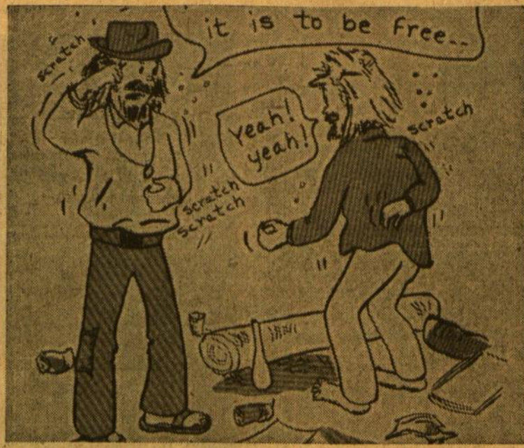
Aš rašalų litrais laku, Džiausiais kaltūnais aplipęs Krypuoju lengviausiu taku. Aš darbu visokiam abuojas