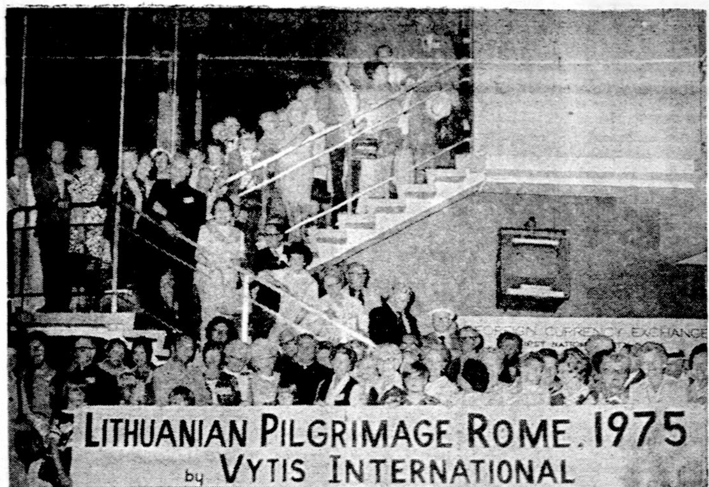
Sventųjų Metų lietuvių kelionės dalyvių grupė Kennedy aerodrome New Yorke. Keliauninkai grįžo iš Europos liepos 4 d. Išvyką organizavo Kunigų Verybė ir Pasaulio lietuvių katalikų bendrija. Techniškus reikalus tvarkė kelionių agentūra "Vytis". Ekskursijoje dalyvavo 182 asmenys. Buvo aplankyta Vokietija, Šveicarija ir Italija.

× GYVULIAI VASARĄ Gyvulių globos draugija priėmė, kad vasarą nereikia palikti automobilių, nors ir pradarus langą, šunų ar kitų naminių gyvulių. Jie gali nuo karščio nualpti ar nugausti. Išvažiuojant dviračiu nereikia vestis prie dviračio prišti šuns.