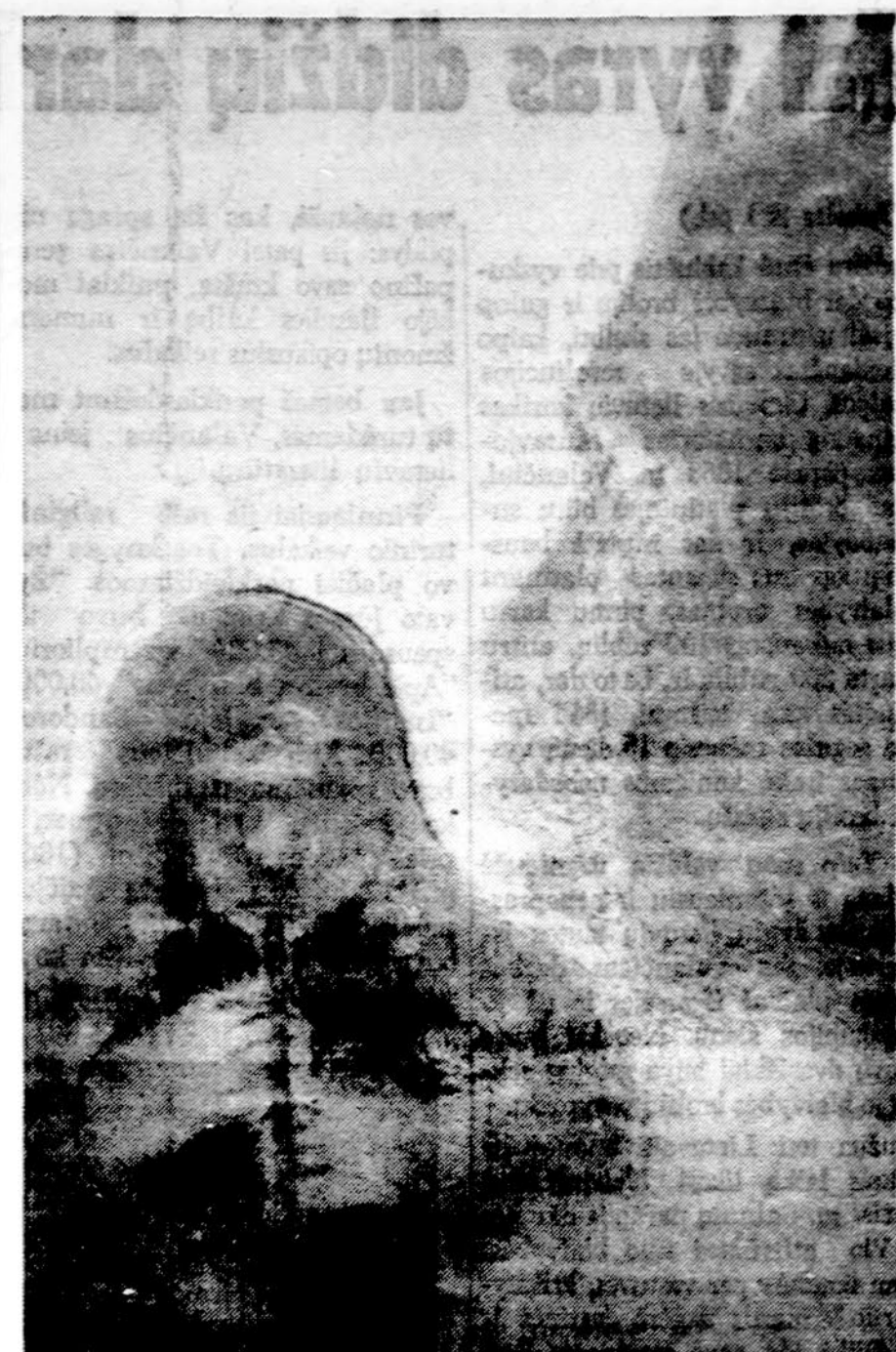
M. K. Čiurlionis (1875-1911)