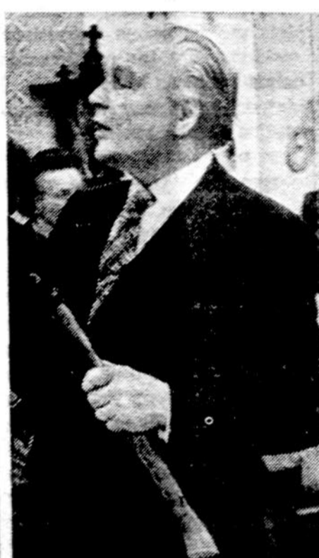
Muz. Balyš Pakštas.

Dėl savo vulgarios kalbos, dėl moterų, kurių dieta yra vyrų keitimas, kaip pirštinių numetimas, dėl viso iškūto — filmas tikrai ne vaikams ir ne jaunuoliams. O vis dėlto noriai ieškoti ir surasti moralą — kurio rašytoja gal ir nemanė pinti. Kai redaktorė išmetama iš savo pozicijos, kai jaunuolė January pameta tėvo amžius vedusį "mylimąjį", užkliūva mintis, o gal ir tos visos ydos, nedorybės pasmerkiamos?