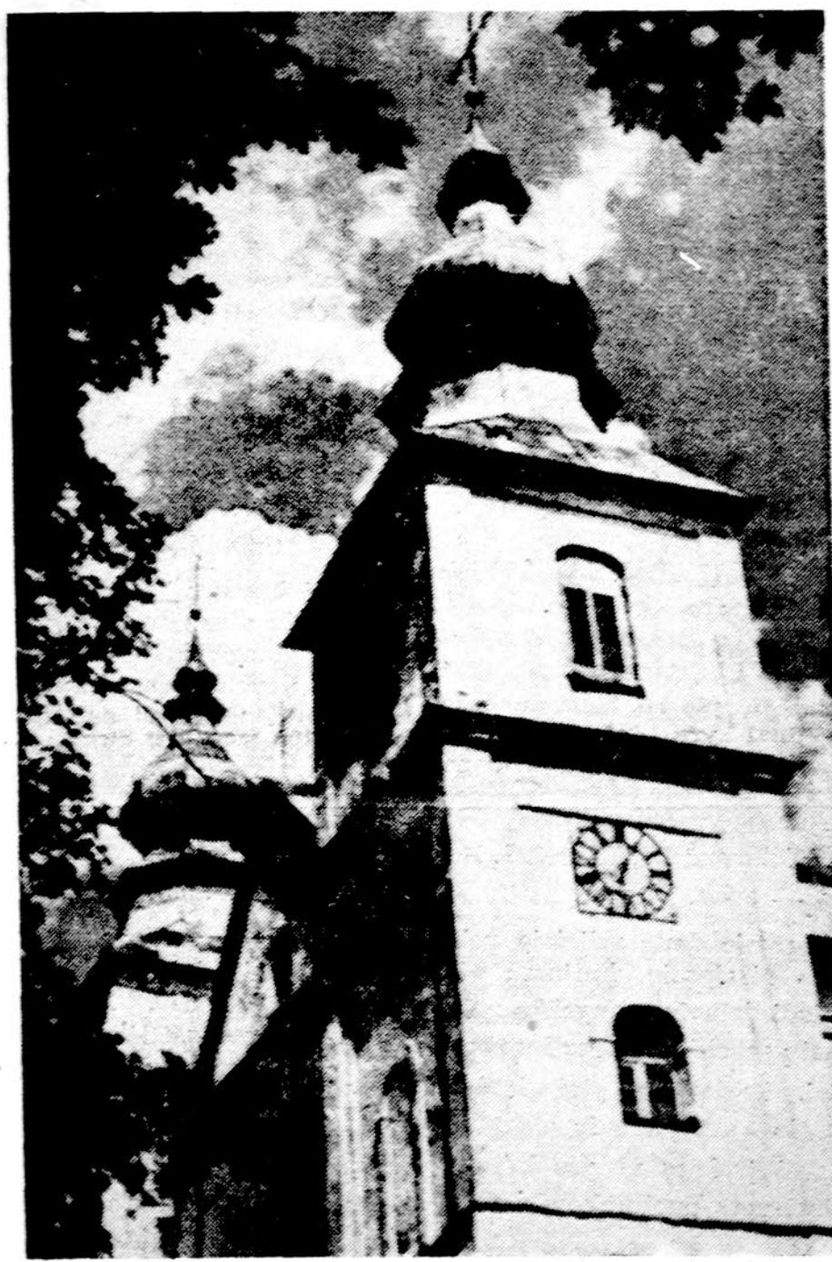
Varnių mairinė bažnyčia, buvusioji Žemaičių vyskupijos katedra. Čia savo veiklą pradėjo vyskupas Motiejus Valančius.

Pirmiausiai jis rašė religinio turinio veikalus. Tos knygos buvo plačiai paskleidžiamos. „Zyvatų Jėzaus Kristaus“ buvo išspausdinta 45,000 egzempliorių, „Apie brostą blaivybės“ 40,000, „Istorijos naujojo Sandoro“ 40,000. Kitų Valančiaus raštų buvo spausdinama mažiau. Nėra ko stebėtis, kad dešimtmetyje prieš spaudos uždraudimą (1864 m.) Lietuvoje spaudinių skaičius pakilo. 1844-1853 metų tarpe buvo išleista 121 lietuviška knyga, o per sekančią dešimtmetį —