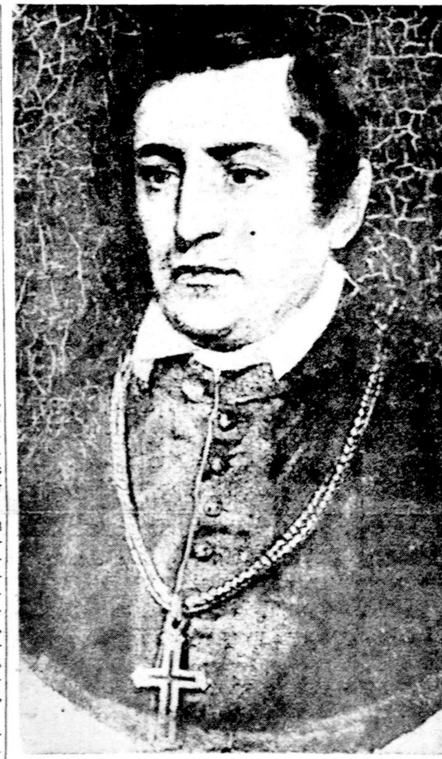
Vyskupas Motiejus Valančius (1801-1875)

Visi tie dalykai dar gan keisti ir gal net nemalonūs. Bet jiems nepasiduodant, nieko kito prieš nepastatant ir nežinant, kaip išeiviską visuomenę suinteresuoti, mūsų dabartinio sukirpimo kūryba domėsis vis mažesnis, vis daugiau ribotas ratelis žmonių, ir jo paties mažėjimas visuomet dar kels vis didesnį ir didesnį rūpesčių. Mesti kaltę vien surambėjimui ar nutautėjimui būtų per daug paviršutiniška. Reiktų dar gerai pasvarstyti, kodėl mūsų dabartinio sukirpimo menai modernų žmogų nejudina, kas kritikuotina juose ir kodėl. O laiką ir naują visuomenę suprantanti kritika turėtų pasiūlyti mūsų kūrybai įdomesnių ir kiek daugiau jaudinančių uždavinių.