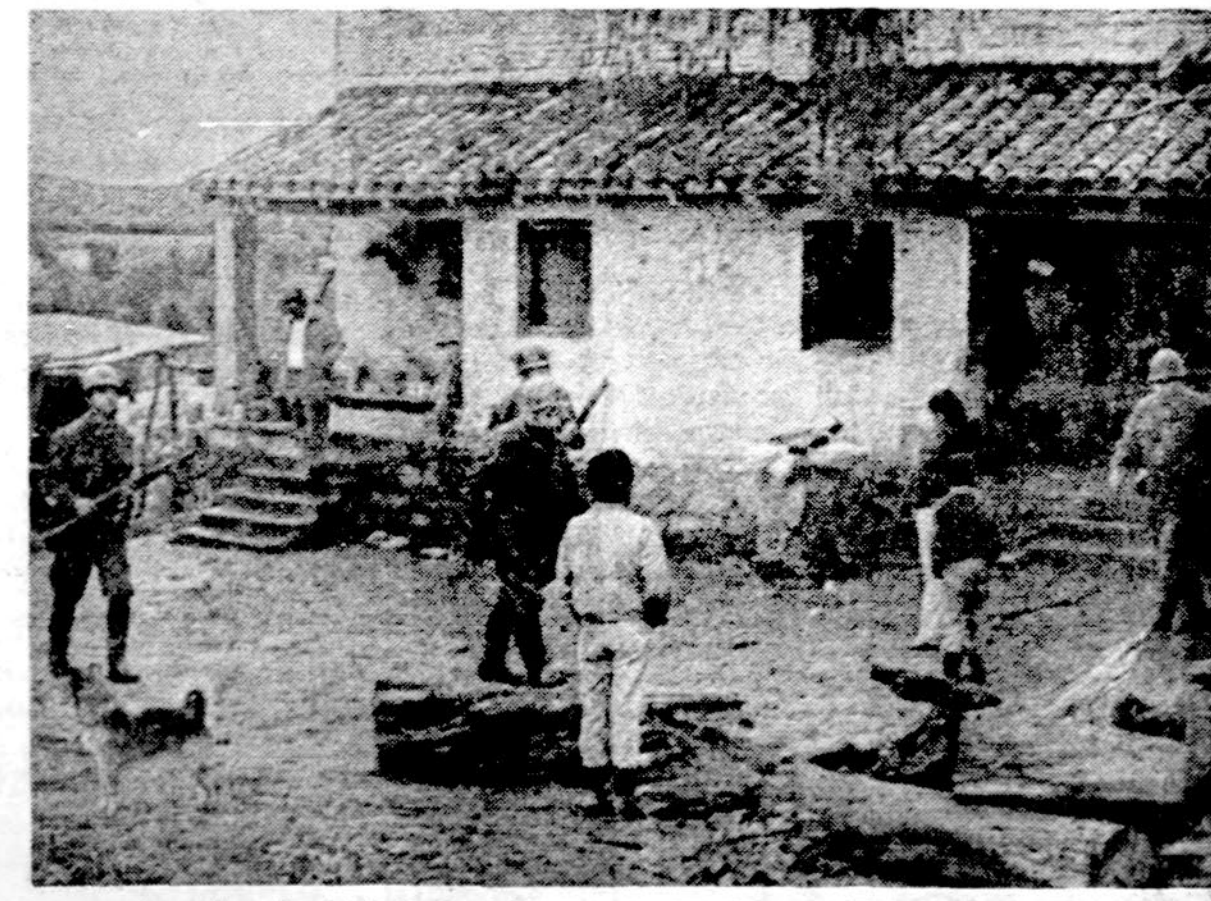
Argentinos kariai, ieškodami Monteneros teroristų, kriaia įtartinus namus

WASHINGTONAS. — "News week" rašo, kad prezidentas Fordas apgailestauja savo neapgalvotą žygi, atsisakymą susitikti su Solženicinu. Pakvietimas šiam Nobelio premijos laureatui bus įteiktas jam. Solženicinui, labiau priimtiniu būdu.