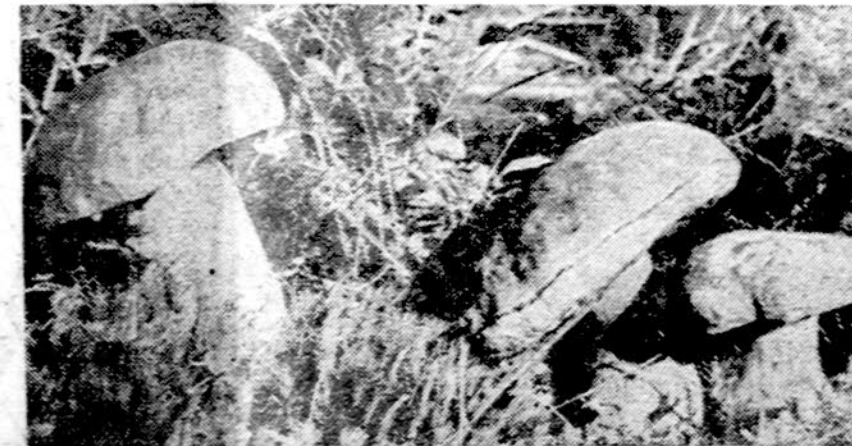
Mažieji grybautės ir lietuviškieji grybai-baravykai