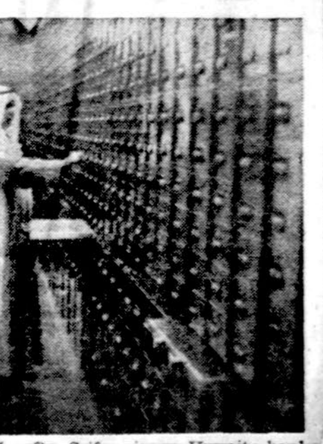
Kur arabai laiko savo milijonus už naftą. Seifas vienam Kuvaito banko

WASHINGTONAS. — Prez Fordas yra tikras, kad Kongresas patvirtins Amerikos susitarimą su Izraeliu. Neutralio zonoj tarp Egipto ir Izraelio bus dės 200 amerikiečių ir operuos naujausiasis seikimo aparatais, saugos, kad nė viena pusė nepažeistų susitarimo.