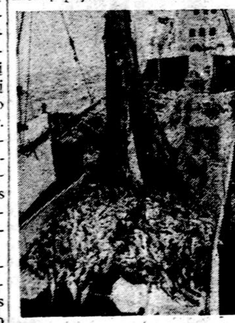
Moderniškiausiomis žvejybos priemonėmis sugaunama daug žuvų. Tačiau jų kiekis pasaulio vandenyse pastaruju metu labai sumažėjo

Krašto ūkio vyksmas yra palnus, nes jis liečia daugelį ūkio sričių ir toli ne vienodai padėtyje esančių pramonės šakų. 912 įmonių pajamos antrame ketvir-