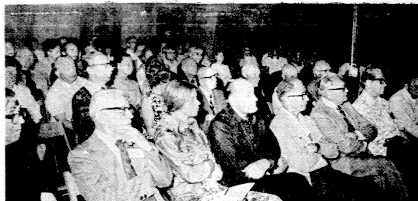
Ateitininkų jubiliejinė stovyklų svečiai klausosi literatūros vakaro programos.