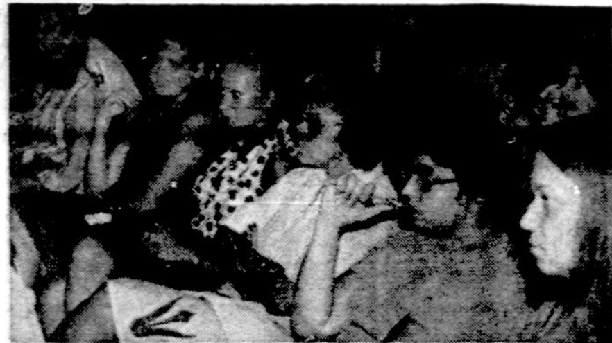
Lietuvių tautinių šokių vadovų kursų dalyviai klausosi dail. A. Tamonaičio paskaitos Dainavoje.

— Kas myli, lengvai tiki ir kitų meile. A. Diama