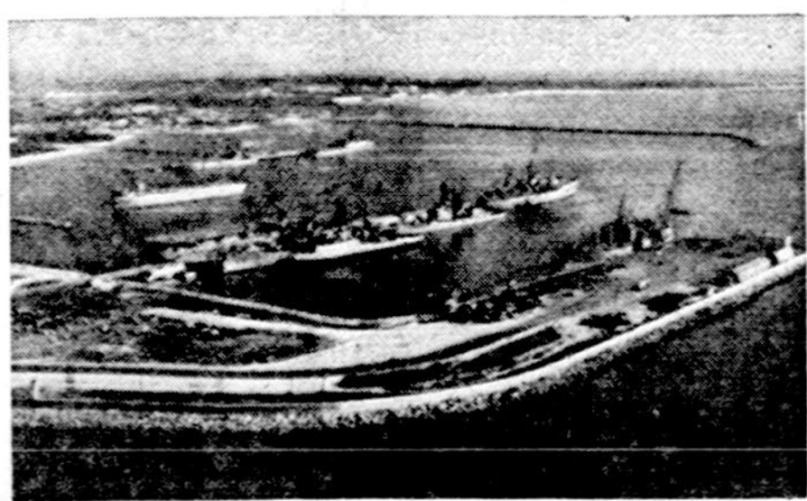
Amerikiečių povandeninių laivų bazė Rota, Ispanijoje

Dalinai saulėta, kiek šilčiau, apie 75 laipsniai.