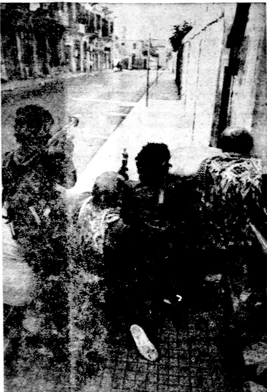
Palestiniečiai partizanai Libane kaunasi su dešiniaisiais falangistais

Neseniai jis rado savo studiją užrakintą. Kai pradėjo aiškintis, kas tai padarė, prisistatė fotografas ir pareiškė, kad jam ši patalpa atiduota. Neizvestny įjėjęs į vidų rado savo kūrinius sudaužytus, sumaltus. Fotografas sekė, kad jis tokioj padėty studiją perėmė, ir niekas nežino, kas tai padarė. Žino tik KGB.