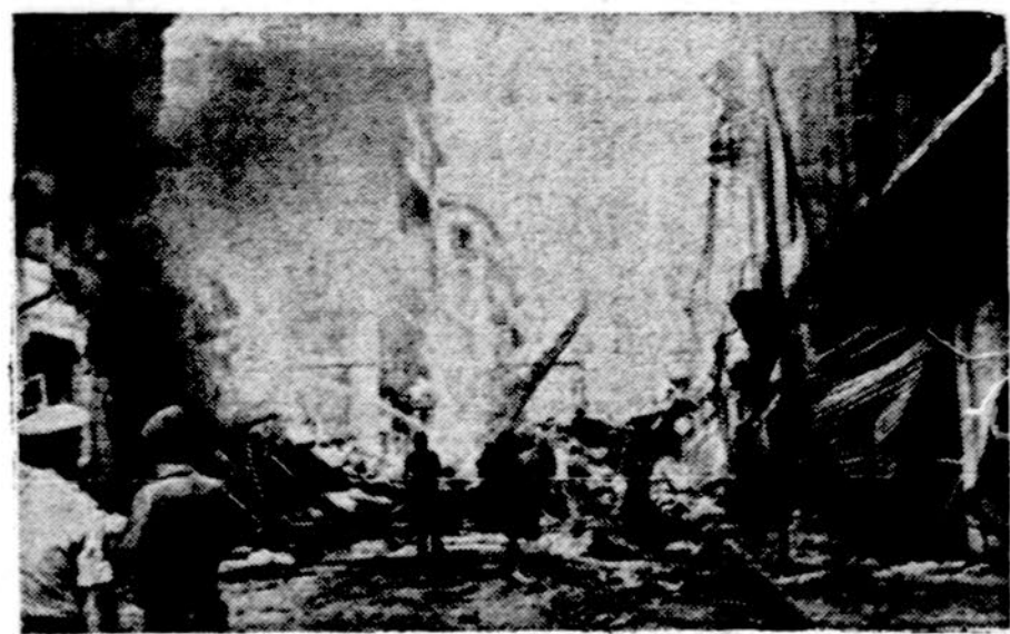
Civilinis karas Beiruto gatvėse

GRAZAS. — Daugiau negu 30 vokiškai kalbančių katalikų kunigų taip pat ir šią vasarą dvasinai aptarnavo užsienio tu- ristus 29 Jugoslavijos kurortuo- se. Kiekvieną sekmadienį buvo rengiamos pamaldos vokiškai kalbantiems turistams. Šios pa- maldos ir turistų pamaldumo pavyzdys turėjo didelės reikš- mės ir Jugoslavijos Bažnyčiai, pakėlė vietos tikinčiųjų dvasią ir suteikė naujų impulsų tikėji- mą viešai išpažinti.