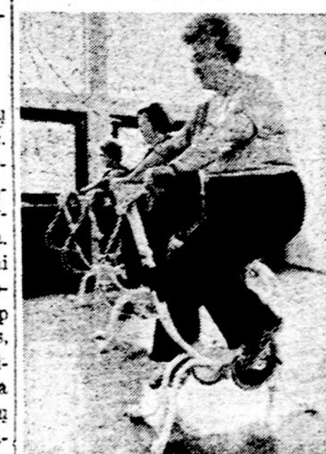
Nutukimas vargina daugelį vokiečių. Kaip vieną iš priemonių suplonėti, gydytojai pataria "važinėti" dviračiu. Čia matome suplonėjimo kursų Schwarzwalde.

Cilės nepriklausomybės paskelbimo 165 metų proga, Santiago katedroje surengtos iškilmingos pamaldos. Jų metu tartame žodyje, Santiago arkivyskupas kardinolas Silva Henriques visus kvietė saugoti ir gerbti žmogaus asmens kilnumą. Kardinolas pažymėjo, jog paties Kristaus mirtis art kryžiaus Kalvarijos kalne buvo pati didžiausia žmonių auka už žmogaus teises. Gerbti žmogaus teises ir saugoti jo kilnumą mus taip pat ragina Kristaus Evangelija, kalbėjo Cilės kardinolas, pažymėdamas, jog Bažnyčios ir civilinės valdžios pareiga yra ugdyti pagarbą žmogaus teisėm ir jas saugoti.