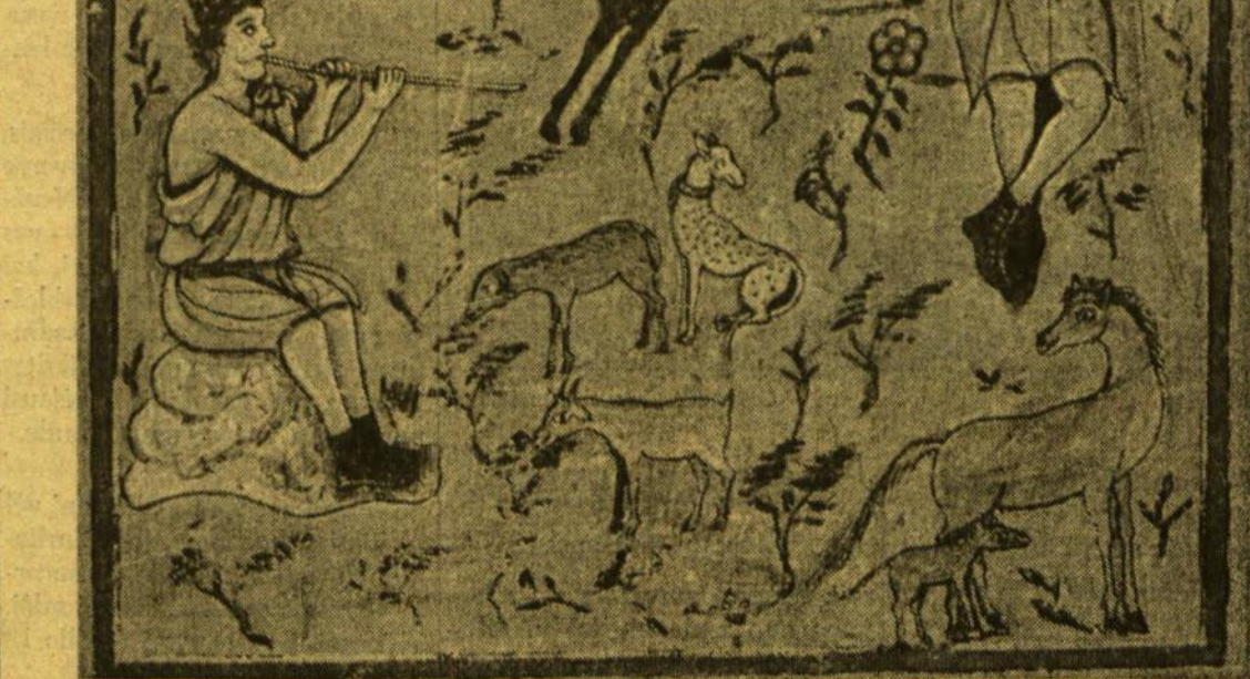
Bukolikoj Vergilijaus kūrybos. Ilustracija sename manuskripte

Ganiava — ožkaganiai, jaučiaganiai, aviganiai — tada buvo kažkas didžiulio naujo poetikai, artima dievo Pano pasaulėjauta, natūralaus gamtovaizdžio viešpatija. Nenuostabu, kad tas "grįžimas į natūralumą", visad atrodo kaip gaida dailėje ir rašte. Graikų švelnioji kultūrinė diktatura stumte stumė romėnų autorius ta