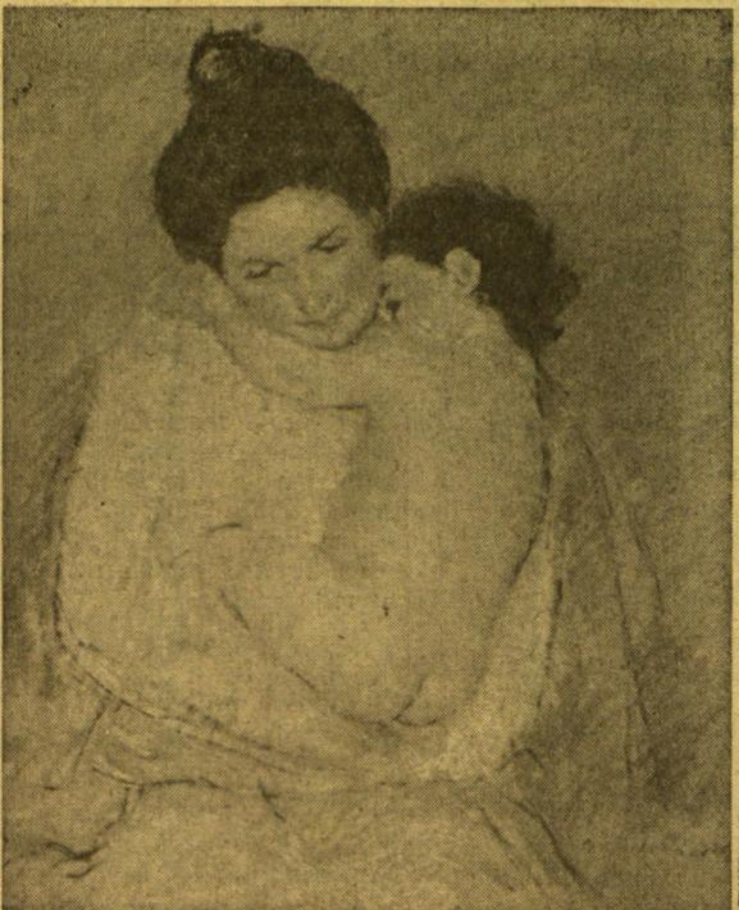
Mary Cassatt (amerikietė, 1844-1926)