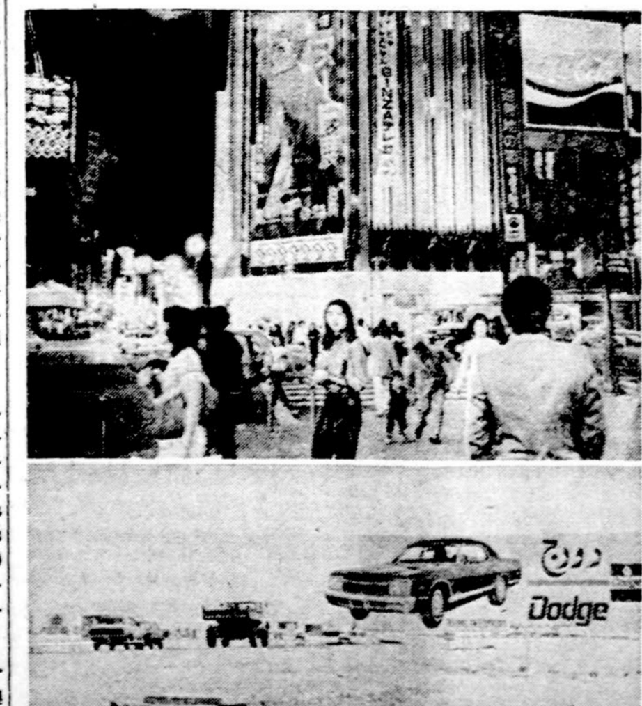
Amerikiečių filmų ir prekių reklamos užsieny — viršuje Tokio, apačioje viename Saudi Arabijos mieste

Chicago. — "Chicago Daily News" vedamajam apie Ivano bėdas sako, jog šių metų sovietų grūdų derlius yra toks blogas, kad kiekvienam piliečiui jų teks tiek, kiek buvo 1913 metais, caro laikais. Ir tai svarbiausia dėl to, kad marksistų-leninistų teorija žino geriau, negu ūkininkai, kada nuimti derlių, ir iš viso, kaip tvarkyti ūkį.