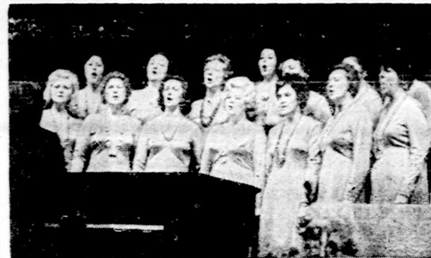
Moterų choras, vad. muz. S. Sližio, atlieka programą Ciurlionio minėjime Detroito.

Kiekvienais metais Amerikos Lietuvių Balso radijo klubas, ku-