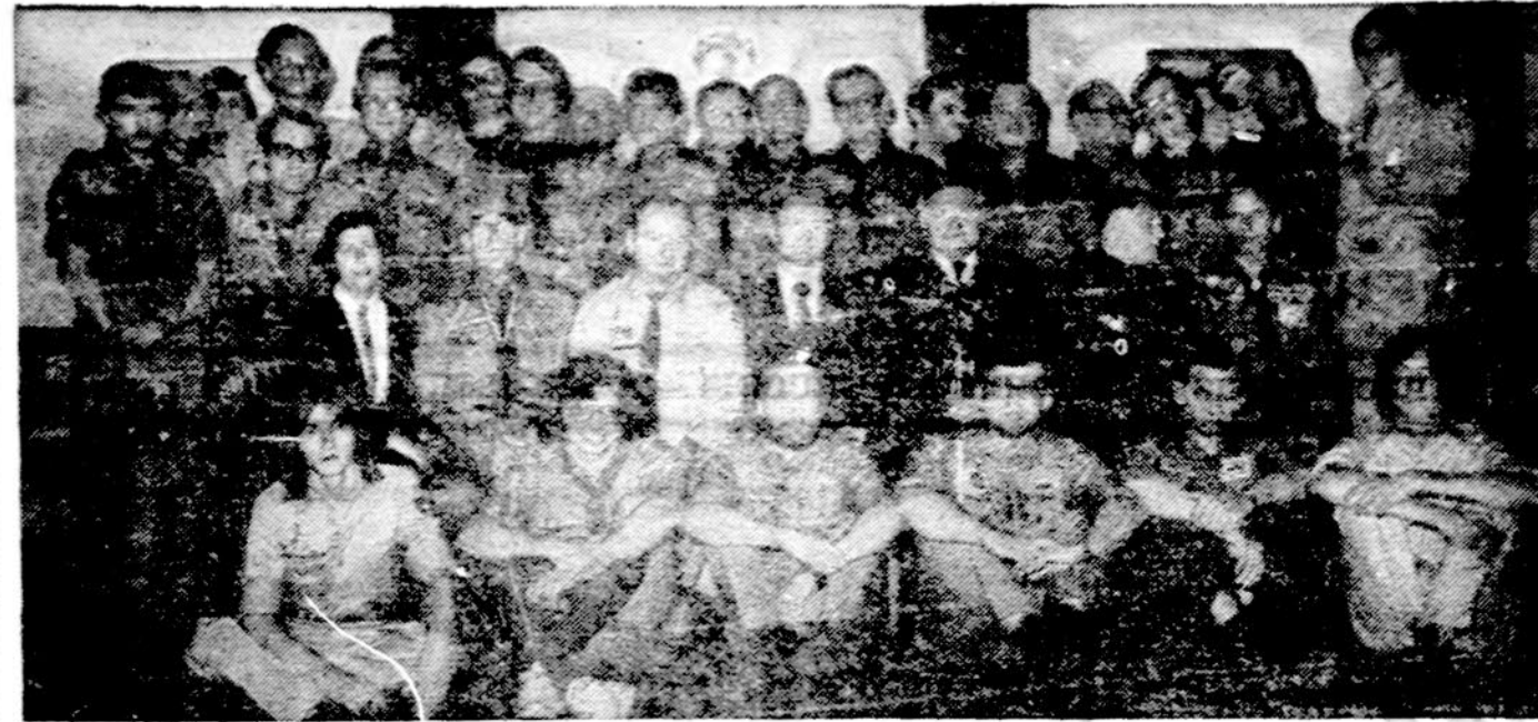
Gausiausio L. S. Brolijoje Chicago Litanicos tunto dabartinė vadovybė.

Pareiga Dievui ir savo kraštui visuomet buvo pagrindinė neginčijama Jungtinių Amerikos Valstybių skautų doktrina. Kadangi stojimas į sąjungą savanoriškas, tai jaunimas, kuris negali laikytis šių principų, arba pasišalinti iš sąrašų, arba ne-