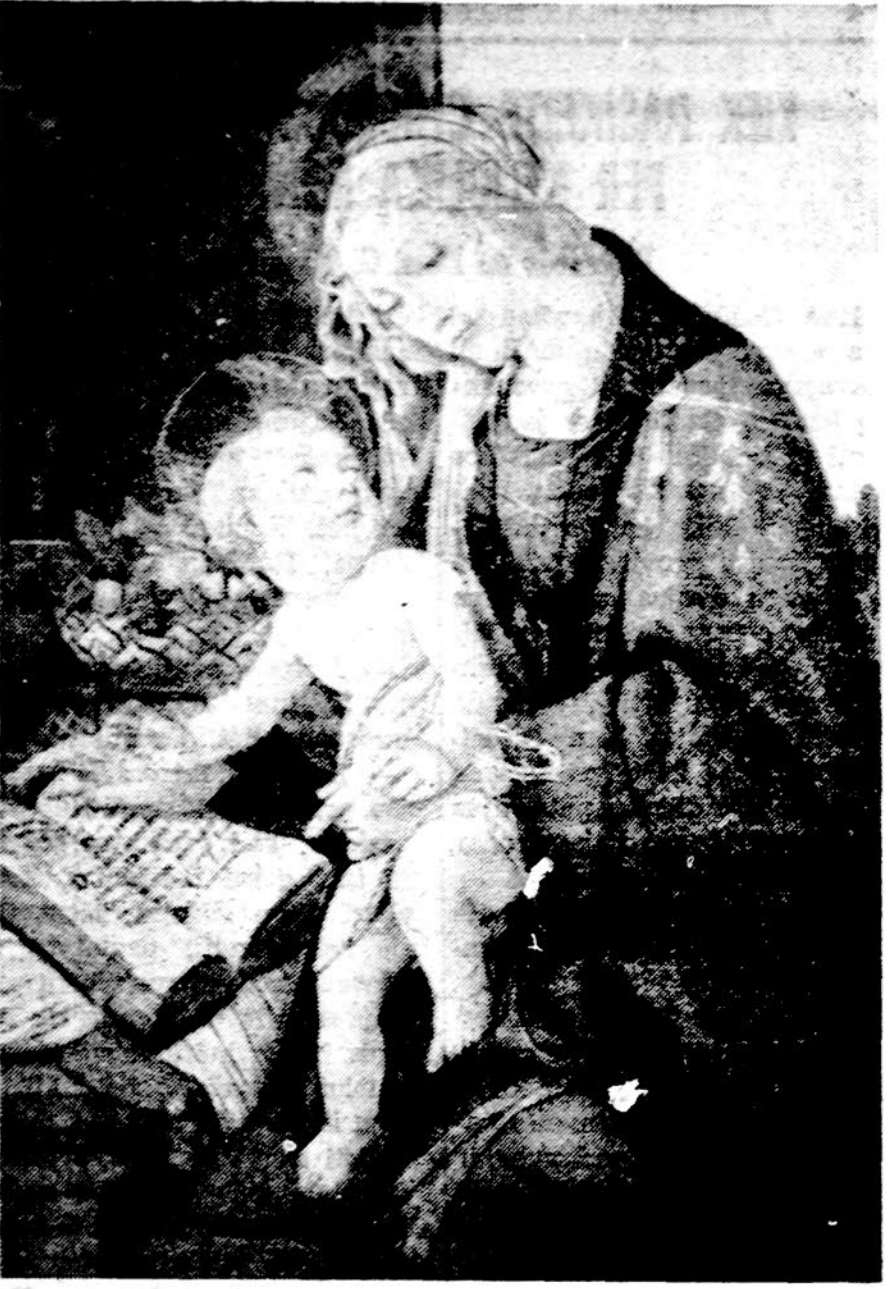
Dievo Motina su Kūdikiu. Dail. Botticelli kūrinys

1976 m. valstybinio ūkio planas kiek skiriasi nuo ankstesniųjų, nes ypatingą dėmesį kreipia į apsiginklavinimą, sunkiąją pramonę, Sibiro ūkio vystymą, ypač Tobolsko ir Tomsko srityse.