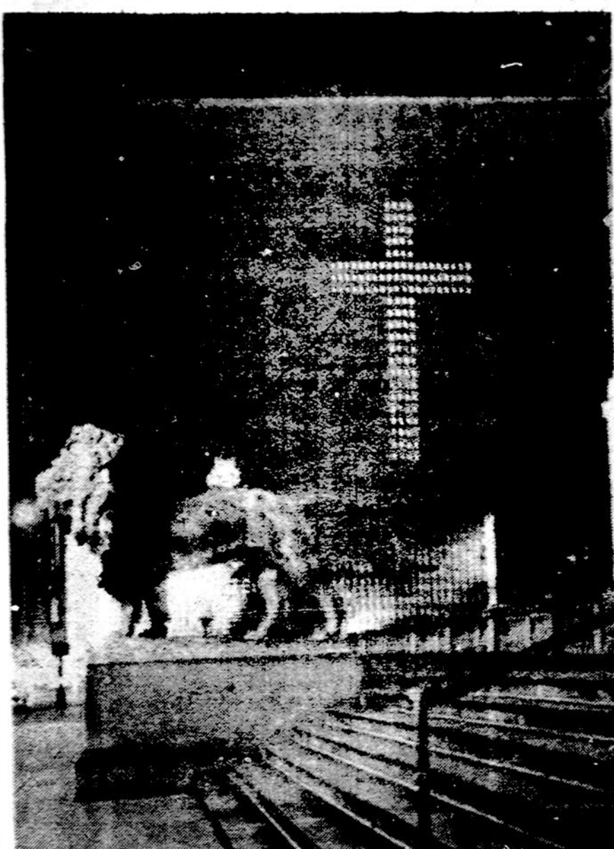
Kryžius ant Prudential pastato Chicagoje. Kryžių sudaro pastato 136 apšviesti langai, yra 275 pėdų aukščio.

— Būdingas bruožas yra tas, kad lietuviai Clevelande mus labai nuoširdžiai priėmė ir labai savanoriškai jungėsi ir jungiasi tiek į įvairių darbų atlikimą, tiek į planavimą žvelgiant į ateitį. Tai padarė mūsų kūrimosi pirmuosius metus ne tik lengvesnius, bet ir labai malonius. Clevelande turime visą eilę kūrybinių vienetų ir individualių kūrėjų. Teminėsiu tik vieną kitą: "Čiurlionį", "Grandinėle", "Razgėdintą chorą", "Tėvynės garsų"