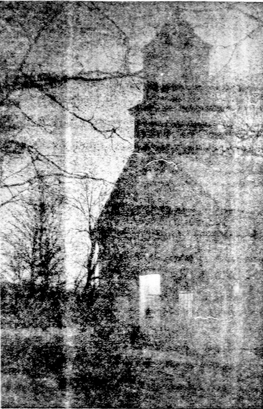
KAS YRA KALĖDOS

Buenos Aires. — Prezidentė Peronienė, sukrista po bandymo ją nuverst, pakartojo savo nusištamą likti savo pareigose iki kadencijos pabaigos, 1977 metų.