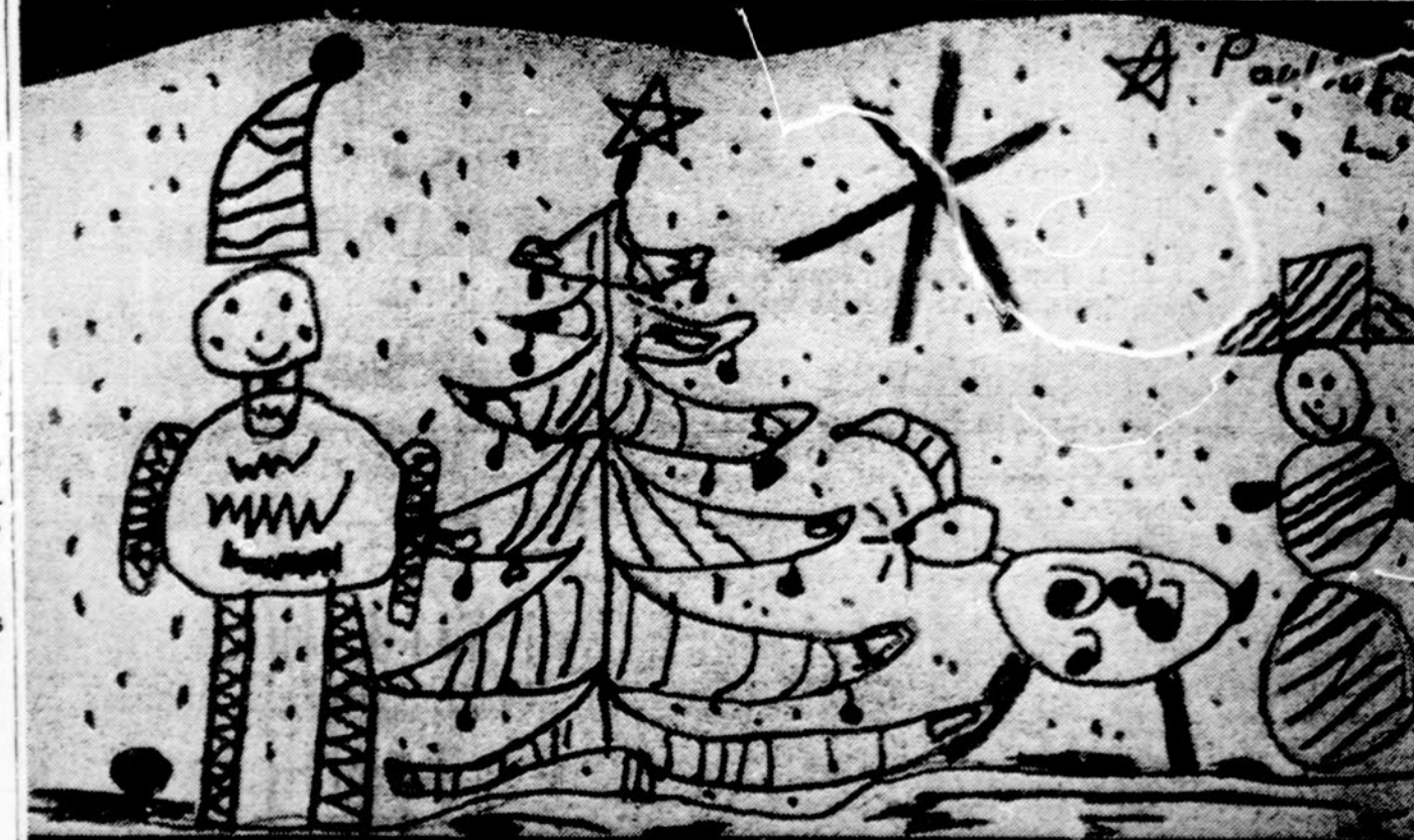
Naktis prieš Kalėdas. Piešė Paulius Lipinis, K. Donelaičio lit. m-los II sk. mok.

y. 1 sasiuvinį ir dar vieną sasiuvinį, tas mokyns būtų gavęs 2; tuomet būtų atlikę 4 sasiuviniai. (6-2), kurių padalyti į šešias dalis nepaauštydami negalime. Taigi ne 6 sasiuviniai buvo nupirkti. Sakysime, kad buvo pirkti 12 sasiuvinų. Tuomet pirmasis mokyns būtų gavęs 12:6, t. y. 2 sasiuvinus ir dar 1, — viso 3 sasiuvinus; po jo būtų likę 9 sasiuviniai (12-3), kurių taip pat į 6 dalis padalyti negalime. Tad ir 12 netinka; tą patį galime pasakyti apie 18 ir 24 (patikrinkite). Bet jeigu paįmsime 30 sasiuvinų, tai pamatysime, kad pirmasis mokyns gavo 30:6, t. y. 5 sasiuvinus ir dar vieną sasiuvinį, viso 6; po jo atliko 24 sasiuviniai (30-6); antrajam mokiniui buvo duota 24:6, t. y. 4 sasiuviniai ir dar 2 sasiuviniai, iš viso 6 sasiuviniai; po jo atliko 18 sasiuvinų, (24-6), taigi trečiasis mokyns gavo 18:6+3 — viso 6 sasiuvinus; po to atliko 12 sasiuvinų (18-6), — taigi ketvirtas mokyns 12:6+4 sasiuviniai, t. y. 6 sasiuviniai, po jo atliko 6 sasiuviniai (12-6). Taigi penktas mokyns gavo 6:6+5 sasiuvinus — viso 6 sasiuvinus ir daugiau sasiuvinų neliko. Matome, kad mokytojas buvo pirkęs 30 sasiuvinų, kuriuos išdalino 5 mokiniams, duodamas kiekvienam po 6 sasiuvinus. Kas daugiau moka matematikos, gali spręsti lygtimis. V. T. deiktavardžiai yra 1) vyriškos giminės, 2) vienaskaitos formos, 3) vardininko linksnio, 4) pirmosios linksnuotės.