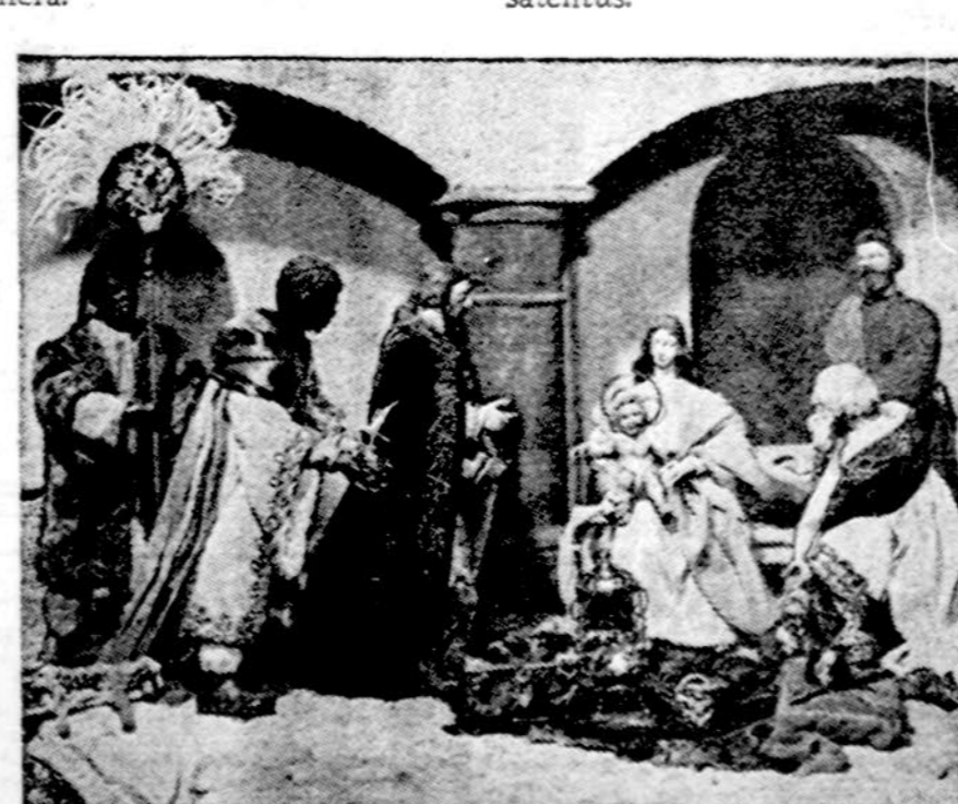
Praktėlė Andaluzijos kaimely, Ispanijoje

New York. — Jungtinių Tautų Saugumo Taryba pareikalavo iš Indonezijos atitraukti kariuomenę iš portugalų Timor kolonij. Pareikalavo dekolonizuoti tą teritoriją ir iš Portugalijos. Indonezija atsakė, kad jos karių ten nėra.