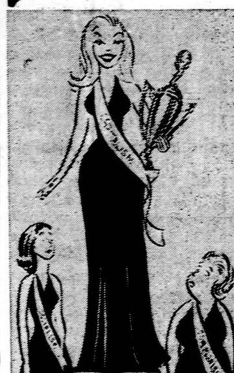
Taip amerikiečiai vaizduoja pasaulio ekonominę pažangą. Ir kitais metais pasaulio gražuolė bus kapitalizmas, o ne ekonominiame gyvenime atsiliekąs socializmas ir komunizmas.

Nebūtų gerai, jei JAV "pavyktų" infliacija pavyti Angliją, kurios vartojamųjų gėrybių kainų rodiklis 1975 paško net 25 proc. Geriau jau mokyti iš Japonijos,