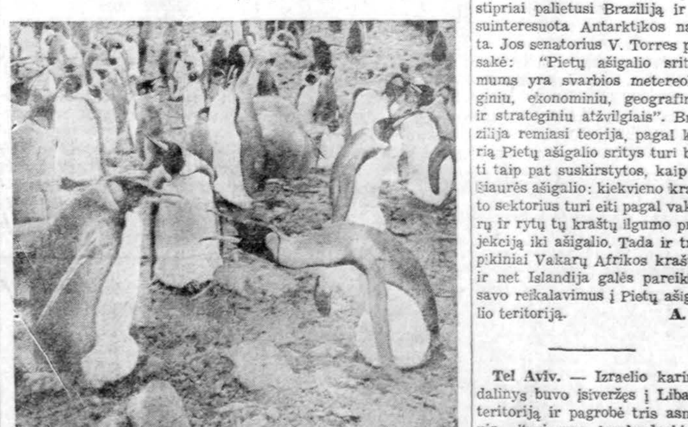
Pingvinai, Antarktikos gyventojai

New York. — Laikė dviejų mėnesių jau antras Lenkijos laivas buvo sulaukytas bevejojais Amerikos teritoriniuose vandenyse netoli Long Island krantų. Laivo išpirkimas brangiai kainuos.