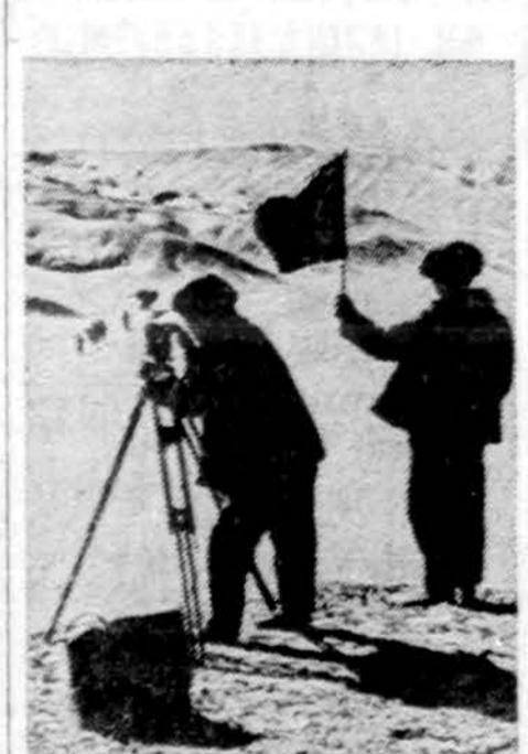
Kinijos žemyne ir artimuosiuose Pacifiko pakraščiuose atrasta tiek daug naftos atsargų, kad, kaip vienas oficialus kinų pareigūnas laikraštiniams yra pasakęs, "nafta supylus į vieną didelę duobę jos būtų tiek, kad joje nuskęstų visi rusai".

agresorių kurstymas. Panašiai kinai elgėsi ir sprendžiant Angolos reikalus. Maoistai nepasmerkė ir nenutraukė ryšių su gėdinga Pietų Afrikos respublika ir Rodezija. Priešingai, Pekinas, grubiai pažeisdamas daugelį Jungtinių Tautų nutarimų, aktyvina savo santykius su rasistinėmis — kolonijinėmis rezimais, remia ir jų ginkluotą intervenciją Angoloje", sakoma Maskvos įvertinime.