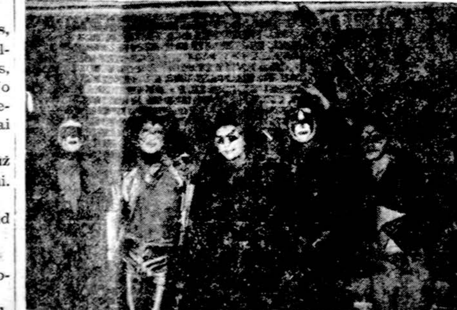
Rock grupė "Mist" Pradėkite Naujus Metus su smagiais šokiais, kurie įvyks 1976 m. sausio 3 d., šeštad., nuo 8 iki 11 val. vak. Jaunimo centro didžiojoje salėje. Gros Rock grupė "Mist". Įėjimas tik 2 dol. (pr.)