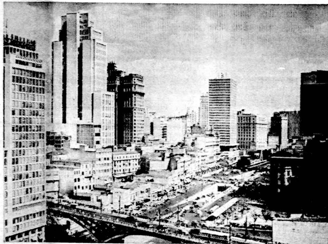
Sao Paulo, Brazilijoje, kur gyvena nemaža Lietuvių ir čia sausio 6 baigiasi III pasaulinis lietuvių jaunimo kongresas