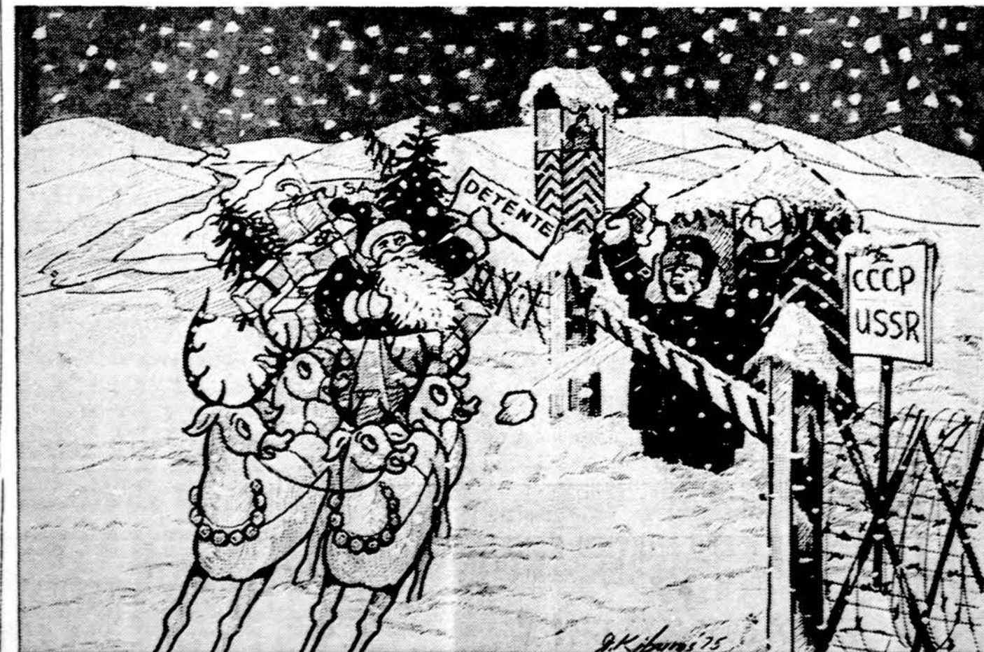
Detantės sutartyje numatytos laisvės yra Vakarams skirta eksportinė prekė, ji jokiū būdu netaikoma kalė jiminei Sovietų sistemai. Pieš. J. Kiburo