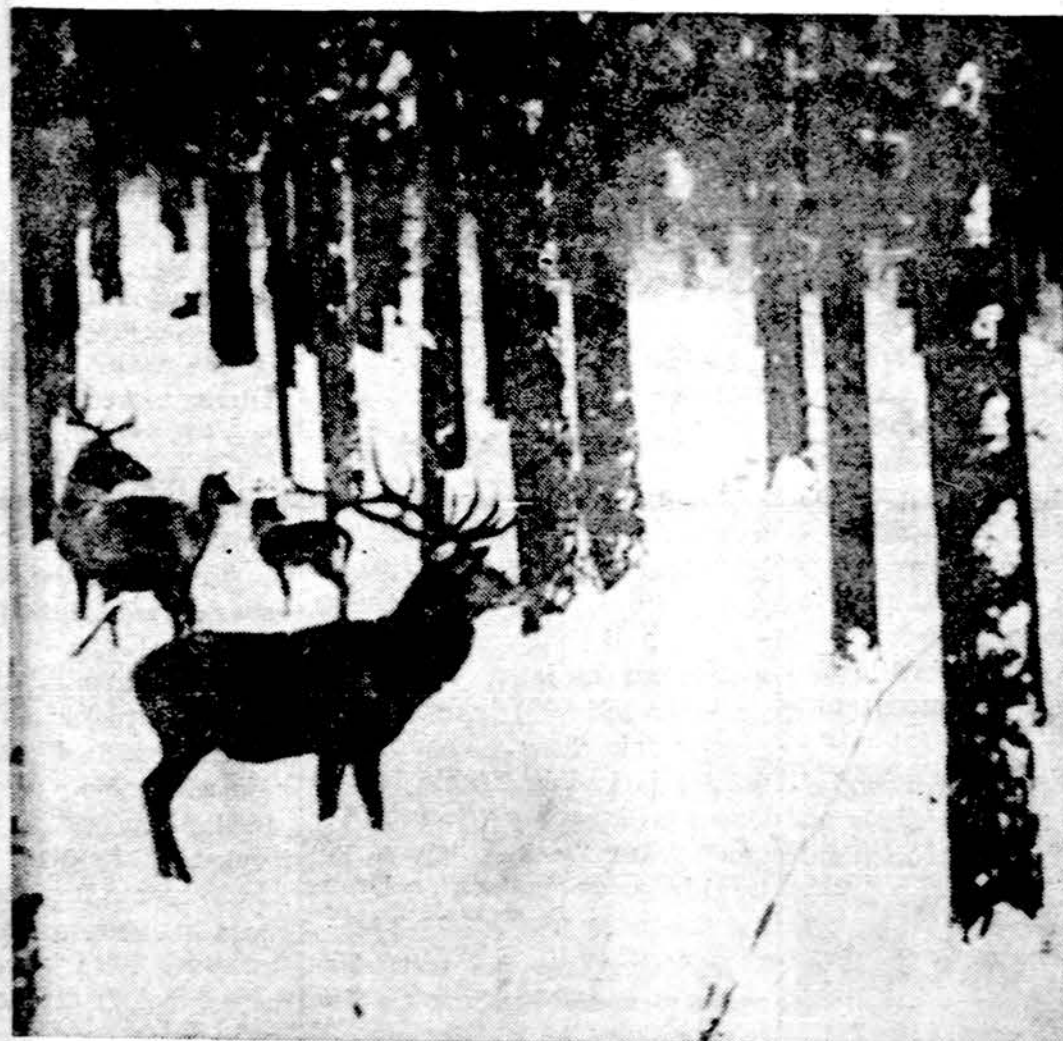
Žiema Romintos girioje, Mažojoje Lietuvoje