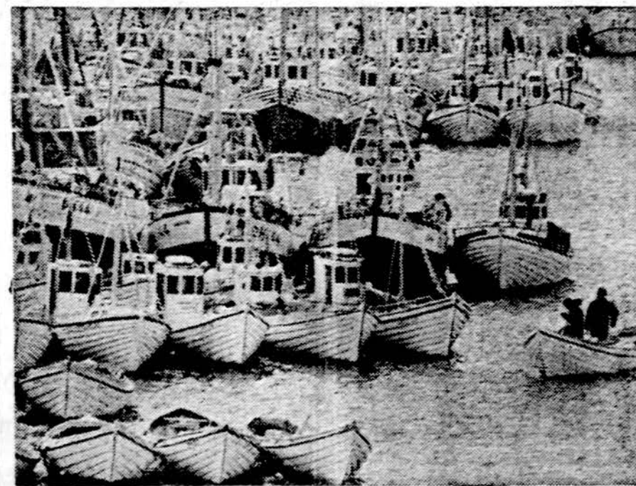
Islandija — šaltas ir labai vargingas kraštas, kurio vienintelis pragyvenimo šaltinis yra žuvininkystė. Islandai labai nepatenkinti, kad prie jų pakrančių atplaukė didžiųjų valstybių žvejybos laivai išgaudo jų žuvis. Taigi visomis išgalėmis reikalauja teisę i jūros nuosavybę išplėsti ligi 200 mylių. "Jūra — mūsų gyvybės ar mirties klausimas" — šaukia islandai. Čia matome vieną jų žvejybos uostų.

Tų visų programų kritikai pa-žymi, kad daugybė priverstųjų so-cialinių programų ištuštino valsty-bės iždą ir paveržė lėšas iš krašto apsaugos. Prez. Fordas mėgino sumažinti kai kurias so-cialines programas, kaip maisto kuponus, ir apriboti socialiniams reikalams skiriamas sumas. Ta-čiau kiti tvirtina, kad prez. John-sono planas buvęs drąsus ir kū-rybingas sumanymas, tik dėl blo-gio administravimo ir Vietnamo karo smarkiai sukludytas.