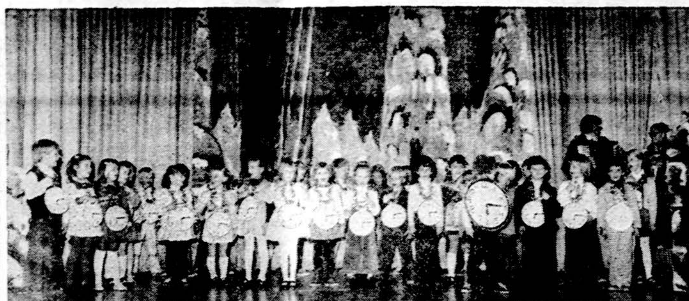
Chicago Kr. Doneleičio pradinės mokyklos parengiamoji ir I-jo sk. "Laikrodėliai", pasirodė Kalėdų eglutės šventėje gruodžio 20 d.