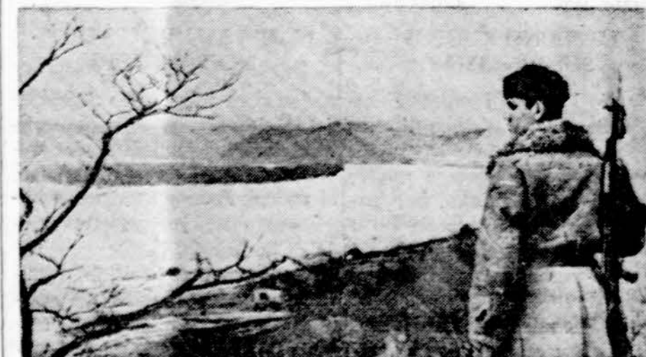
Sovietų sargybinis prie Ussuri upės, Kinijos pasieny

Roma. — Italijos kairiųjų laikraštis "Republica" paskelbė septynių amerikiečių diplomatų vardus, sakydamas, kad jie yra CIA agentai.