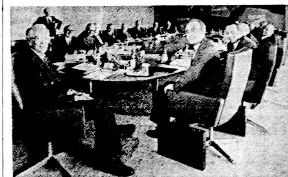
Vakarų Vokietijos centrinio banko taryba savo posėdžio metu aptaria krašto finansinius reikalus.

Portugalijoje diktatūra sugriauta, bet demokratija neįgyvendinta. Kuokuliuojanti anarchija krašte tebevyrauja. Už svajones ir pakrikimą jau išmuše valanda sąskaitas mokėti. O sąskaitos yra nepaprastos. 1975 m.