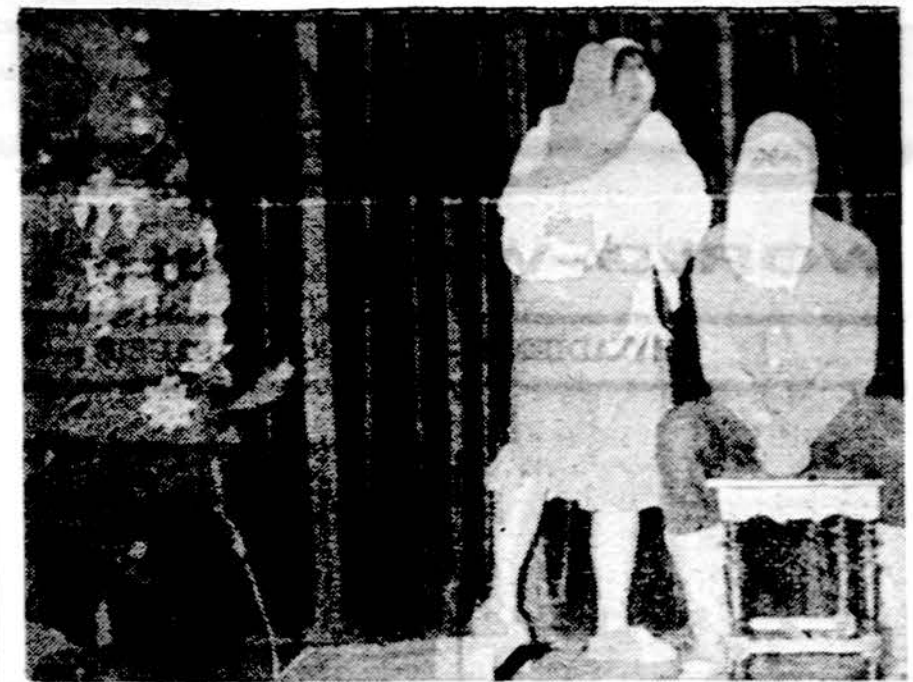
Scena iš Chicago moksleivių ateitininkų pasirodymo Kučių programos metu, Chicagoje.

Sausio 11 dieną jaunimo Centru, Chicagoje, susirinko lipniūniečiai pirmam šių metų susirinkimui. Posėdyje buvo nutarę nekviesti paskaitininko, bet pakviesti mūsų narius, kurie buvo nuvažiavę į kursus, pakalbėti apie kursus — paskaitas, paskaitininkų mintis. Pranešimai buvo labai įdomūs, bet reikėjo atidžiai klausytis. Toliau sekė einamieji reikalai. Kalbėjome apie mūsų ruo-