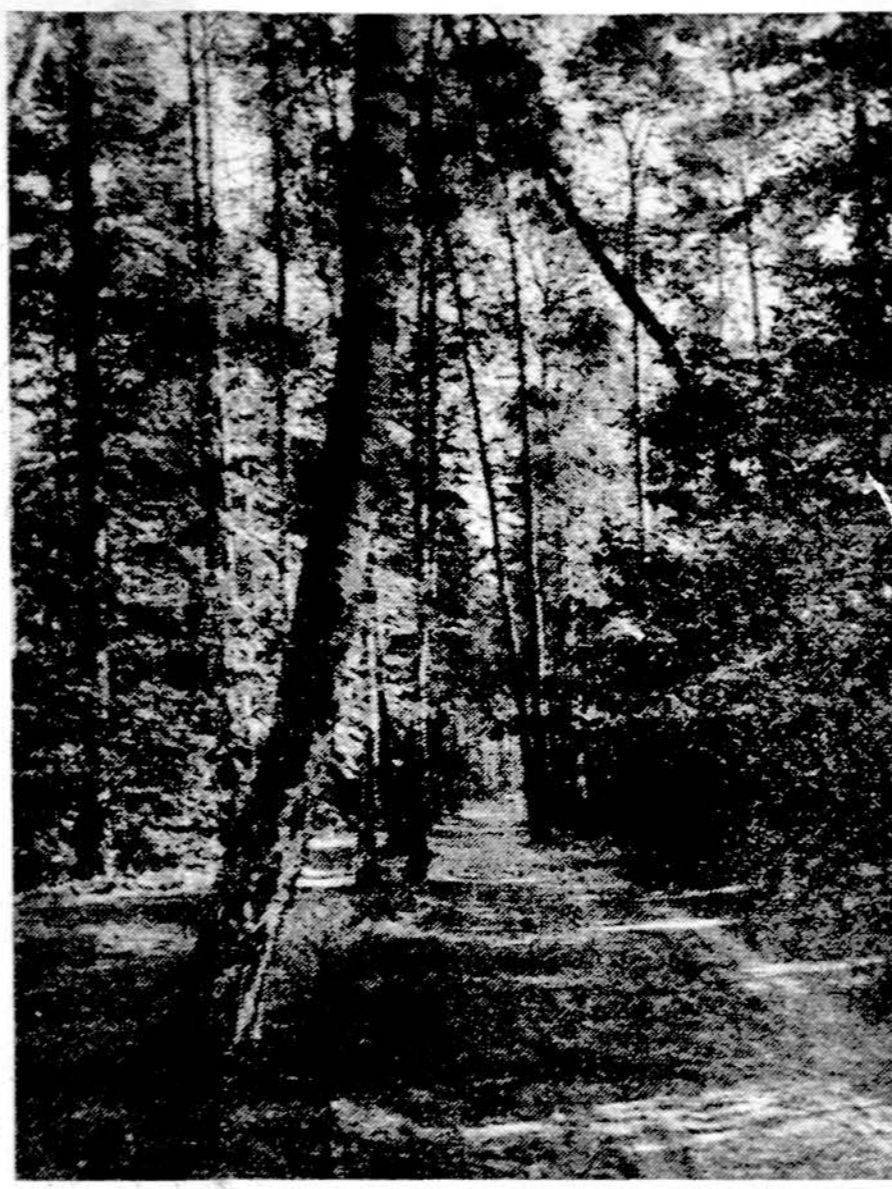
"Pastaciūs Kėdainių superfosfato kombinatą, išdžiūvo prie Kėdainių esantis Juodkiškių miškas... Toks pat likimas iškito ir Jonavos azotinių trąšų gamyklos kaimeynystėje esančius ir kurortinę reikšmę turinčius vaizdinguosius Panerio miškus". ("L.K.B. Kronika" Nr. 20)