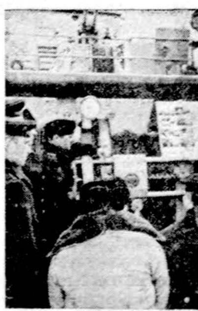
Dėmesio, kalba politinis vadovas! Kiekvienam karo laive politinis vadovas arba politrukas ne tik atsakingas už ideologinį paruošimą jūrininkų, bet ir visomis išgalėmis privato saugoti, kad kareiviai, nuplaukę į svetimą uostą, nepabėgtų

Beirutas. — Libano paliaubos galioja, karas sustabdytas, bet įtempimas jaučiamas didelis. Vakar Beiruto gatvėse buvo maži, spontaniški susisauzdymai, daugiausia tik tarp krautuves plėšiančių gaujų.