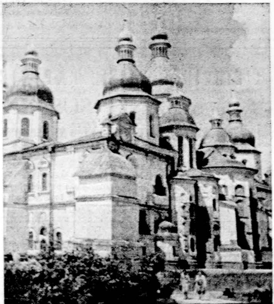
Kijevas. Šv. Sofijos katedra su 13 kupolų, didingiausias ukrainiečių architektūros kūriny. Katedra statyta 11 amžiuje, dabartinę išvaizdą gavo 18 amž. Ukrainiečiai šiandien švenčia nepriklausomybės paskelbimo šventę, nors nepriklausomo gyvenimo džiaugsmo ir negalėjo patirti. Ukrainiečiai su lietuviais riša 250 metų bendrą istoriją, kai jų žemės buvo Didžioiosios Lietuvos Kunigaikštystės sudėtyje, ir jie anuos laikus tabeškai gražiaustu savo istorijos periodu.

Roma. — Jėzuitų vienuolių naujo Statistinio metraščio duomenimis, komunistinėje Kinijoje šiuo metu dar gyvena 123 jėzuitai — 83 kunigai ir 40 brolių. Daugelis jų yra ištremti, ir nei vienas negali eiti kunigiškų pareigų ar dirbti kita su religija susijusį darbą. Metrašties informuoja, kad keli jėzuitų kunigai, nuteisti dvidešimčiai metų sunkių darbų, po dešimties metų gavo leidimą dviem savaitėm sugrįžti atostogoms į namus. Jėzuitų vienuolių vyriausiasis vadovas kun. Arrupe yra pažymėjęs, kad jėzuitai Kinijoje savo kančiomis, ištikimybė tikėjimui ir drąsa liudija Kristų.