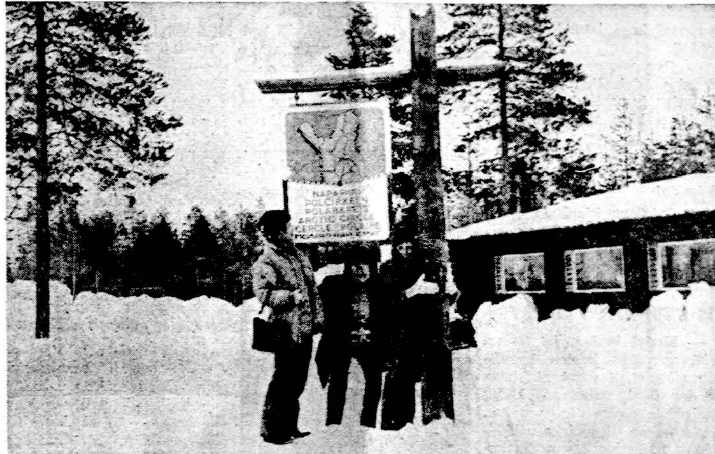
Suomija. Nuo tos vietos prasideda poliarinė sritis.

milicininkų su šunimis, sunkvežimių atpažinimo ženklai. Vaizdai savo šurpumu primena liūdnos atminties nacių koncentracijos stovyklų įrengimus.