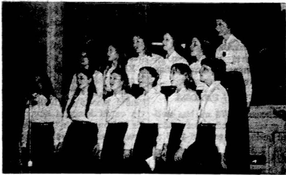
Clevelando Nerija koncerto metu.