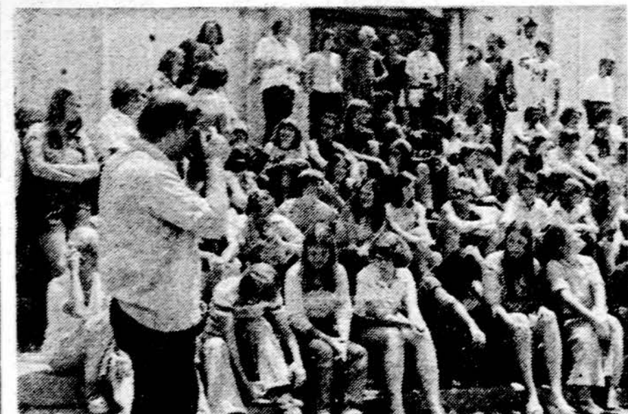
Lietuviško jaunimo diskusijų būrelis Jaunimo kongreso studijų savaitėje Brazilijoje.

Dienraštis "Chicago Tribune" skelb'a, kad rasta duomenų, rodančių, jog ėmimas gimimų kontroliuoti gali sukelti vėžį ir gali būti priežastis tulžies akmenų. Apskaičiuojama, kad kasmet dėl tos priežasties apie 10,000 moterų gali gauti akmenis tulžyje.