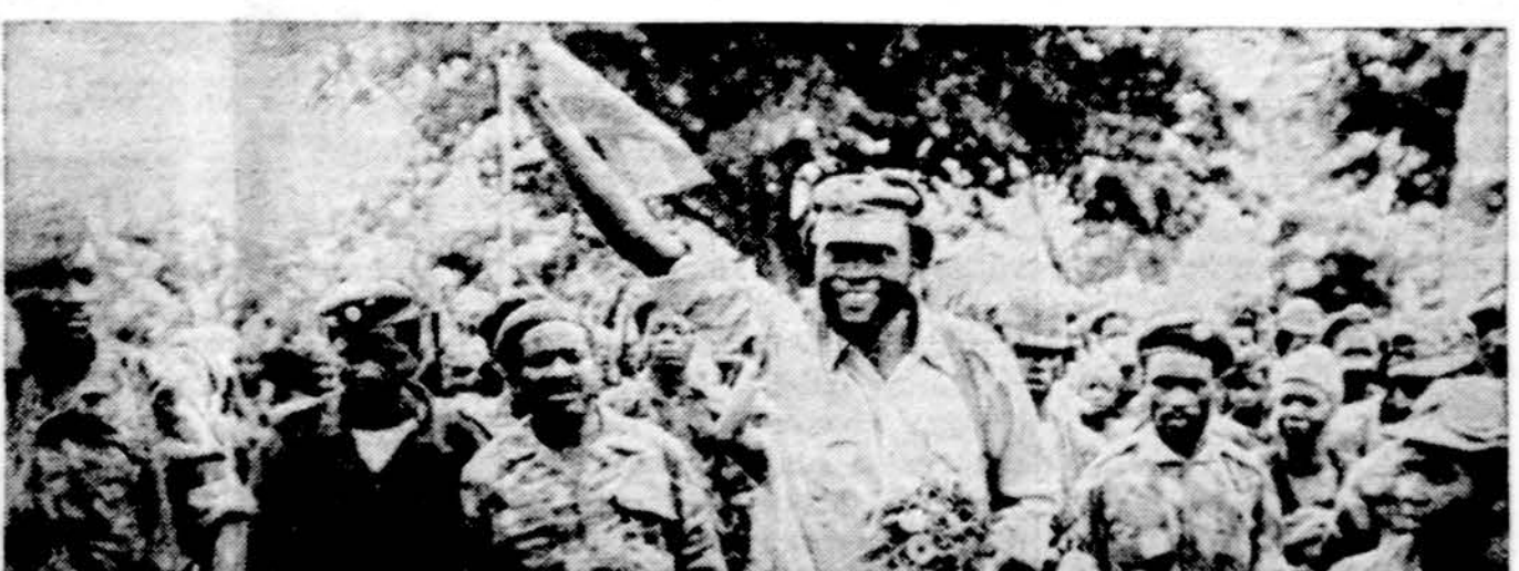
Angoloja. Unita — afrikiočiai, kovoją už pilną krašto nepriklausomybę.

Sausio 30: Martynas, Jacinta, Milgaudas, Zibonė. Sausio 31: Jonas Bosko, Marcelė, Skirmantas, Jaunė. Saulė teka 7:06, leidžias 5:03. ORAS Daugiausia debesuota, gali- mas smulkus sniegas, apie 30 l.