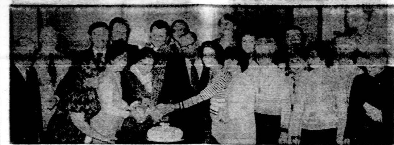
Ciurlonio ansamblio sukakties metu piauamas sukaktyvinis tortas.

Ciurlonio ansamblys, įsikūręs 1940 m. sausio 15 d., sausio 18 d. kukliai prisiminė gimtadienį savo patalpose, Lietuvių namuose