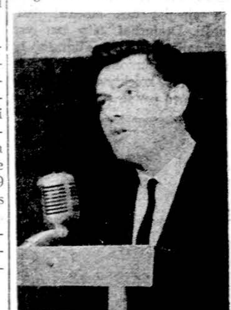
Valdas Adamkus kalbės Vasario 16-sios minėjime vasario 15 d. 4 v. p. p.

Parapijos choras naujo vadovo rankose stipėja ir plečia repertuarą. Klebonas ir parapičiai dainingi chorvedžiai ir choristams.