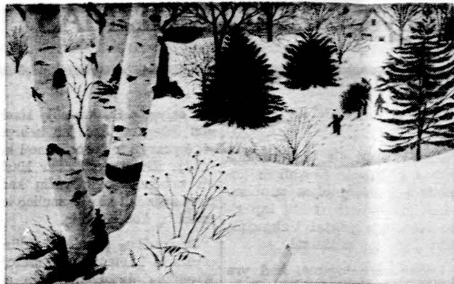
Ziemos gražioji pasaka

Psl. 40: "V. R. Štabą sulikviduojant buvo nuginkluojami ir suimami V. R. daliniai Marijampolėje, Suvalkų Kalvarijoje, Vilniaus mieste ir apylinkėje labai žiauriau būdu. Marijampolėje buvo sušaudyta 2, Vilniaus apylinkėje 83 kariai. Sušaudymai buvo