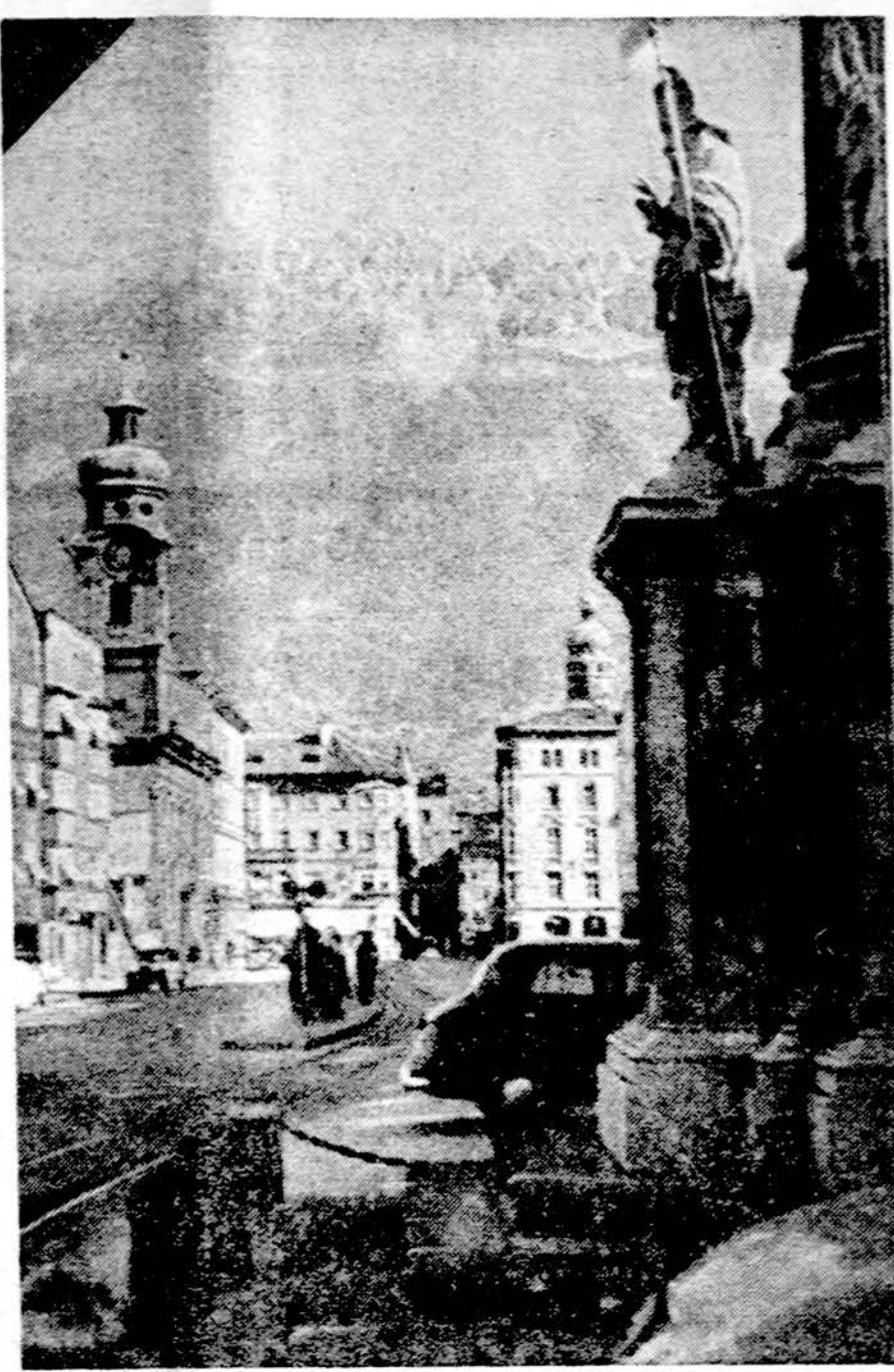
Innsbruckas, Austrija. Čia rytoj prasideda pasaulinė žiemos olimpiada

New York. — Jungtinių Tautų statistikos biuras numato, kad 1980 metais visam pasauly bus 4.5 bilijonai žmonių. Iki 1990 priaus iki 5.4 bil. ir 2000 metais jau bus 6.5 bilijono.