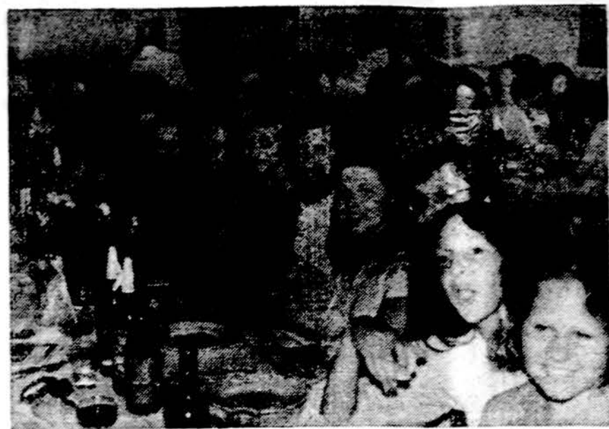
Argentinos lietuvių parapijos salėje kūčios, kuriose dalyvavo vietos lietuviai ir svečiai iš kitų kraštų. Nuotr. A. Šeštoko

× CALIFORNIJOJE, Los Angeles, REIKALINGAS KEPEJAS, lietuvis, mokąs kepti lietuvišką ruginę duoną. Dėl smulkesnių informacijų rašyti: L. REIČYDAS, 1477 Sunset Blvd., Los Angeles, Calif. 90026. (sk.)