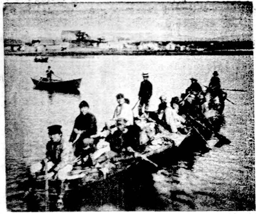
Senieji vietiniai Aljaskos gyventojai — eskimai

Illinois kolegijų ir universitetų programų vystymasis ir naujos statybos sulėtinamos, taupant lėšas. Taip nusprendė Illinois aukštojo mokslo taryba. Taip pat nutarė iki 1980 m. trečdaliu pakelti mokesčių už mokslą.