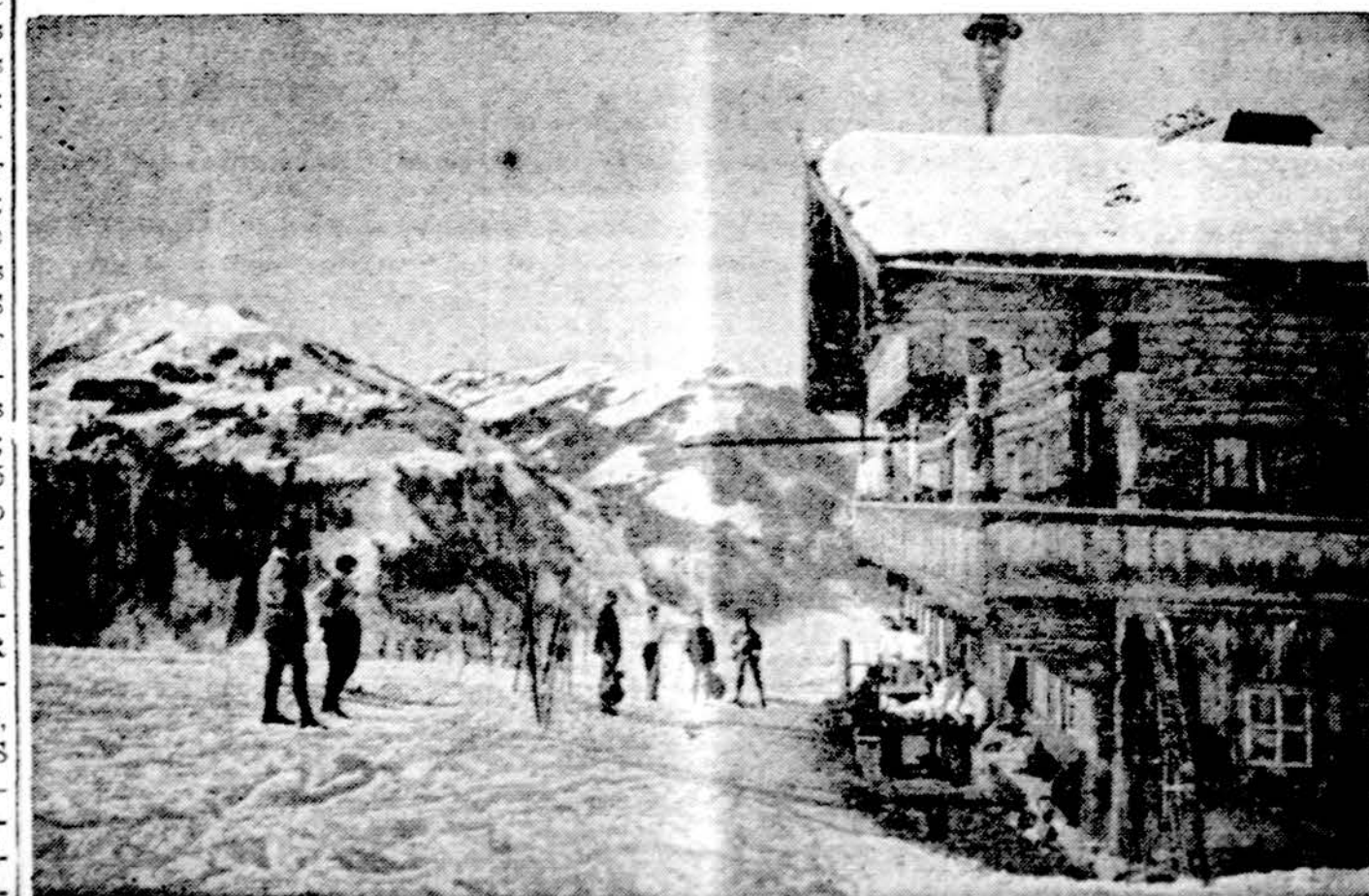
Žiema, netoli Innsbrucko, Austrijoje, kur šiuo metu vyksta pasaulinė žiemos olimpiada

INNSBRUCK, Austrija. — Žiemos olimpiadų iki šeštadienio vakaro Amerikos sportininkai surinko 5 medalius. Daugiau turėjo tik rytiniai vokiečiai — devynis ir sovietų profesionalai — 11. Kiti po mažiau.