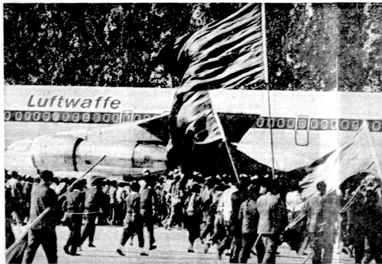
Kai Pekine lankėsi Vakarų Vokietijos kancleris Helmut Schmidas, jį pasitiko karališkai, šią nuotrauką įsidėjo visi Kinijos laikraščiai

Vilnius. — Iš ok. Lietuvos spaudos matyti, kad planuojamas rekonstruoti Kauno - Klaipėdos plentas ir Vilniaus - Panevėžio automobilių ruožas. Numatyta pastatyti naujus tiltus per Nemuną Jurbarkė, per Nerį Gardinuose ir Kaune, siauruosius geležinkelius paversti plačiaisiais, baigti elektrifikuoti Vilniaus geležinkelių mazgą.