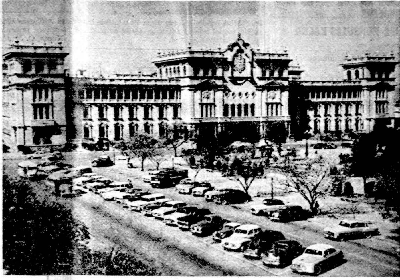
Guatemala. Valdžios rūmai, miesto pasididžiavimas. Ar jie išliko per žemės drebėjimą, dar nežinia