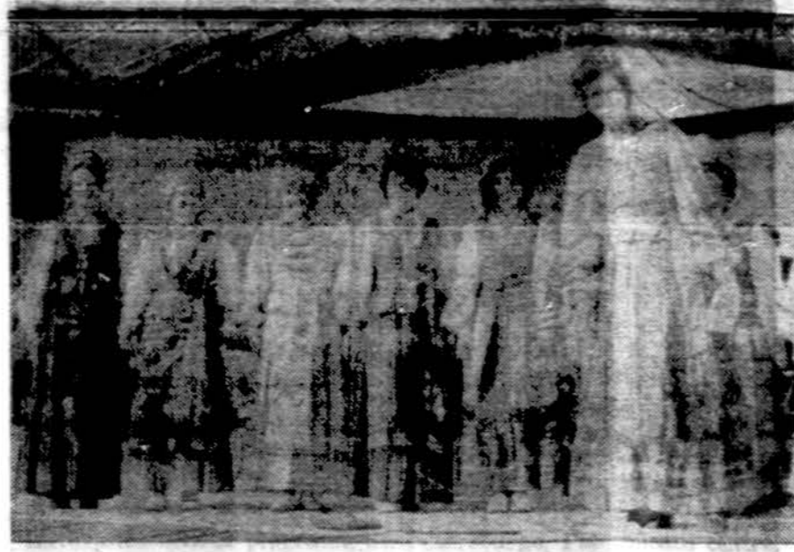
Lietuvaitės atlieka programą St. Petersburg, Fla., miesto centre.