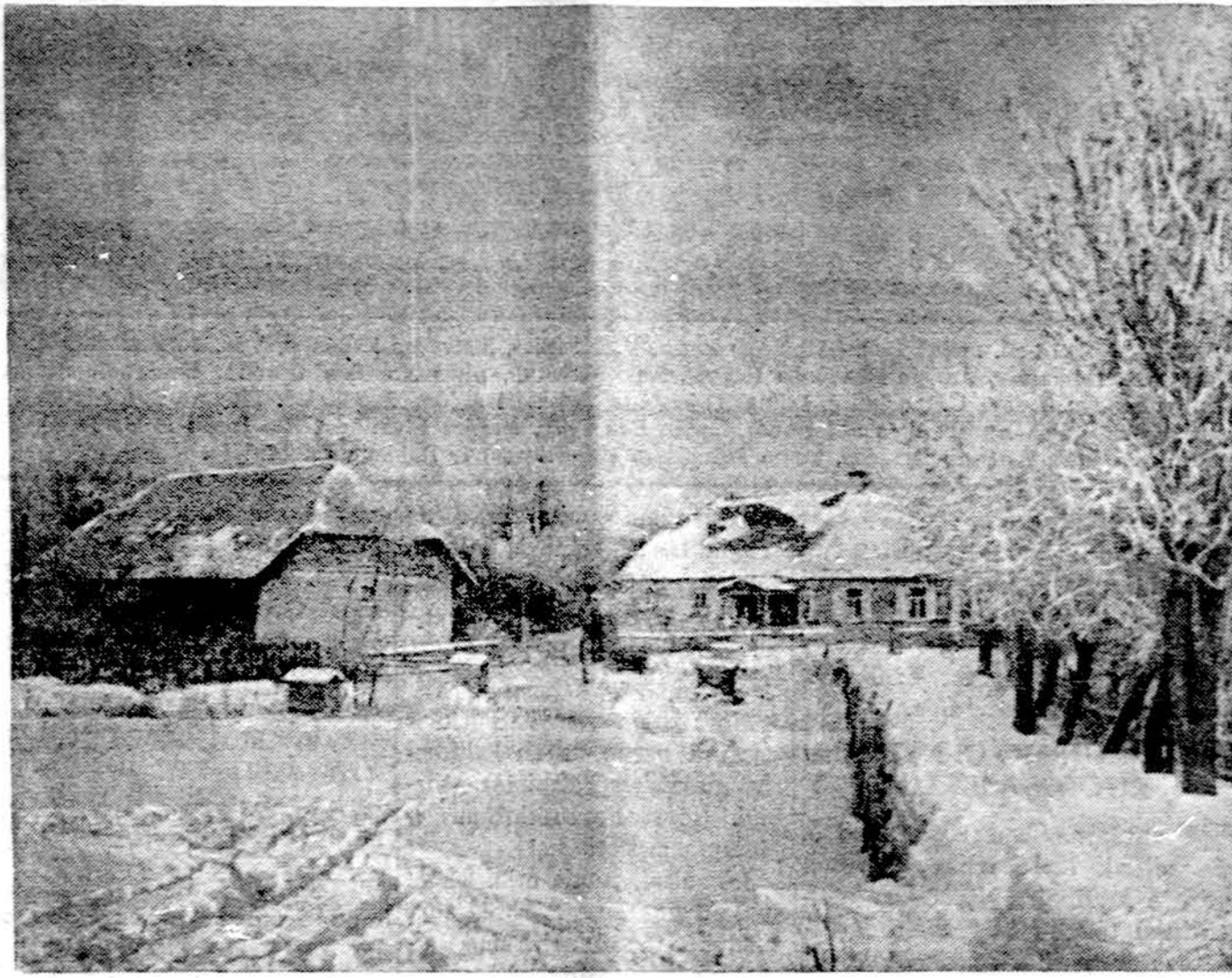
Ziema Lietuvos kaime, Šiaulių apylinkė

Vatikanas. — Paulius VI minėjo, kad Vatikanas pasirodęs persvarstyti konkordatą, sudarytą su Italija 1929 metais.