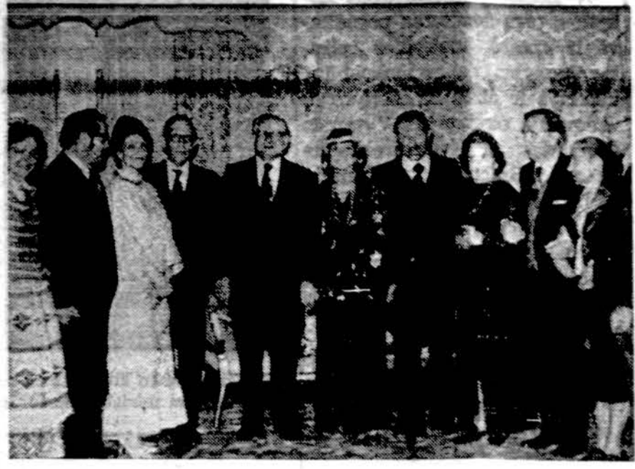
Grupė lietuvių Lietuvos pasiuntinybėje per Vasario 16-sios minėjimą.

ALGIRD MITKUS arba GALAXY TOURS & TRAVEL 8 White Oak Road 141 Linden Street Newton, Mass. 02168 Wellesley, Mass. 02181 Tel.: 617-963-1190 Tel.: 617-237-5502