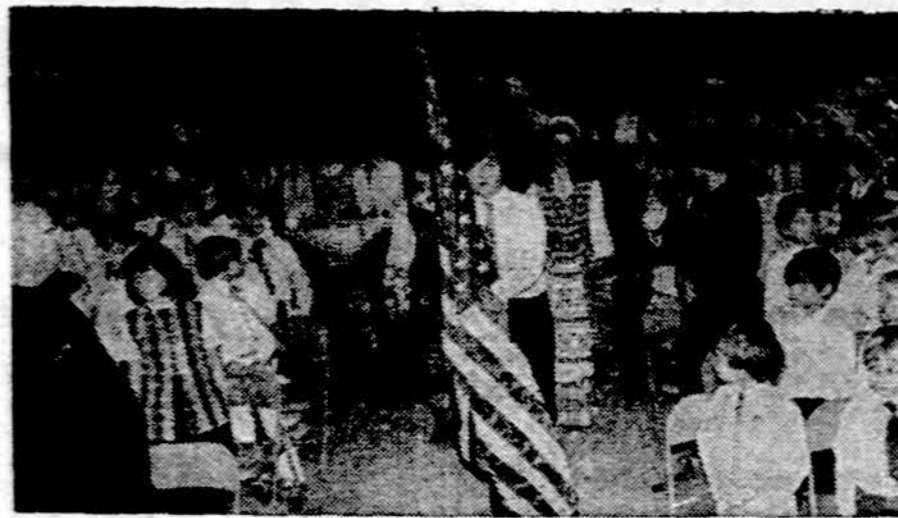
Marquette Parko lituanistinės mokyklos mokiniai įgytuoja su vėliavomis, mokyklai minint Vasario 16-ją.