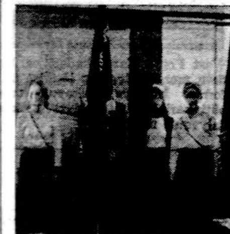
Detroito, Chicago ir Clevelando moksl. ateitininkų atstovai su savo vėliavomis

2. Kęstutis Girmius: Kas yra moralė? Paskaita bus šeštadienį, balandžio 3 d., 7:30 v.v. Jaunimo centro kavinėje.