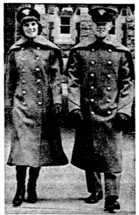
West Point, Karo akademijos, kadetų merginų ir vyrų išieginė uniforma. Moterys išsikovojo teisę būti karininkais, valdyti tankus, dalyvauti mūšiuose

Pekinas. — Kinijoje nuosaikiųjų viršija radikalių elementą, nežiūrint, kad Teng Hsiao-ping ir buvo pažemintas, sakoma diplomatinuose sluoksniuose. Kad Pekinas neatšauktė Nixono vizito, pasikeitus prejerams, rodo, kad ir naujasis min. pirm. Hua Kuo-peng nori palaikyti gerus santykius su Amerika.