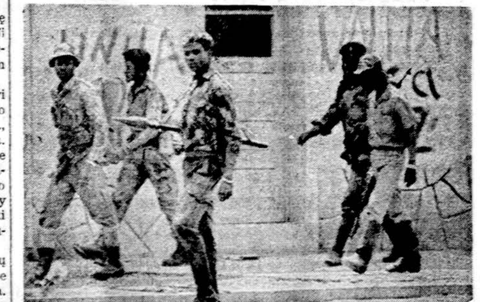
Angoloje pilietinis karas tebesitęsia. Čia matome prieš komunistus kovojančius Angolos laisvės kovotojus — UNITA organizacijos narius. Laimi komunistai

Šis maldavimas gali turėti dvi prasmes. Pirmoji prasmė būtų: suteikite mums paramos, o mes