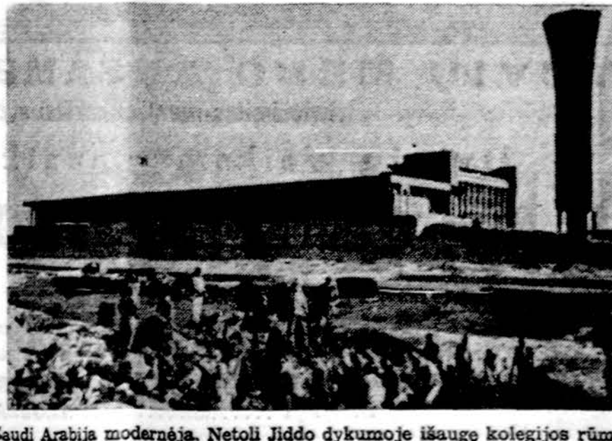
Saudi Arabija modernėja. Netoli Jiddo dykumoje išaugo kolegijos rūmai

Brežnevui apie laimėjimus net nereikės nuo savęs nieko pridėti, užteks, ką jis apie tai paskaitys iš amerikiečių prispajinimų.