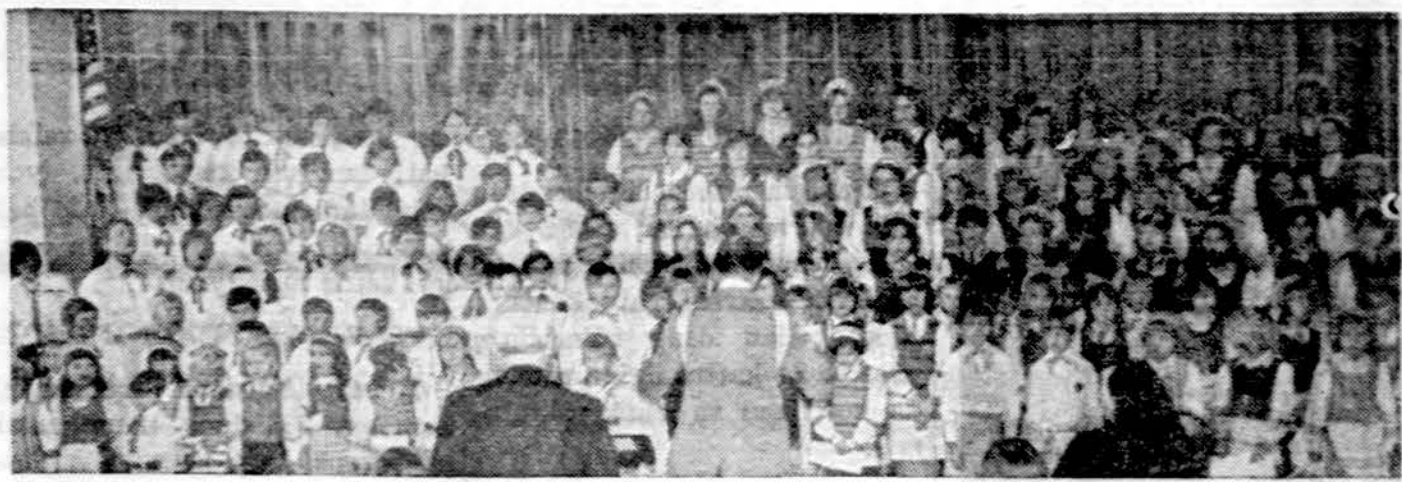
Marquette Parko lituanistinės mokyklos Chicagoje choras su vadovu mokyt. V. Gutausku.