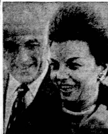
Peronienė ir jos patarėjas

BUENOS AIRES. — Prezidentės Estela Maria Peronienės vyriausybė jau paskelbė datą, kada bus renkamas Argentinos prezidentas — gruodžio 12. Nor