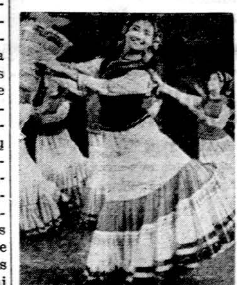
Komunistinės Kinijos mergaitės šoka Krepšio šokį.

Kolektyviniuose žemės ūkiuose dirbantiems leidžiama turėti