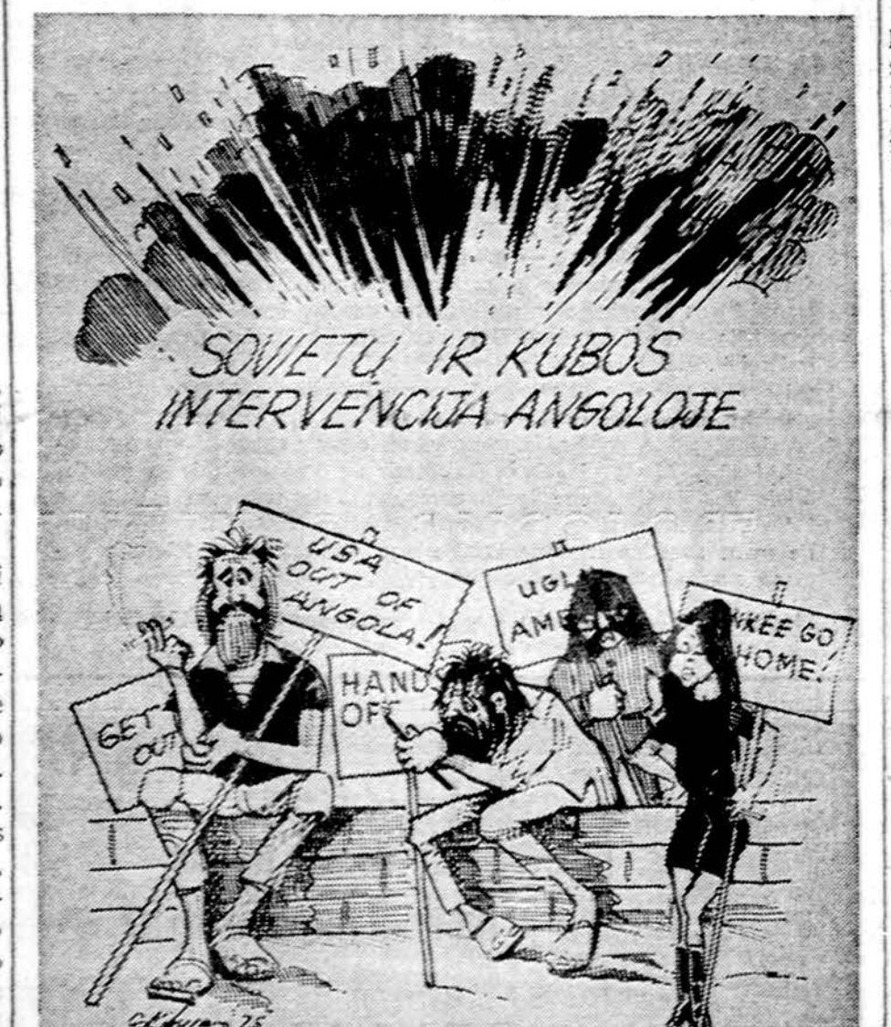
Kai kurie amerikiečiai pasirošė protestuoti prieš Ameriką, kad ji nepadėtų Angolai, bet nieko nesako, kad ten jau sėdi rusai ir kubiečiai. J. Kiburo pieš.

Sovietai gali pasirinkti taikinius ypač sukūžusioje Afrikoje, išstumti baltuosius, įsitvirtinti Afars ir Isas srityje (Prancūzijos Somalijoje) ar talkininkauti Alžirijai vyrauti Vakarų Saharoje. Pradėtas didelis žaidimas pakeisti Afrikos veidui. Bent šiuo metu JAV ir Vakarų Europos valstybės dar nesusigaudo, ką jos turi daryti.