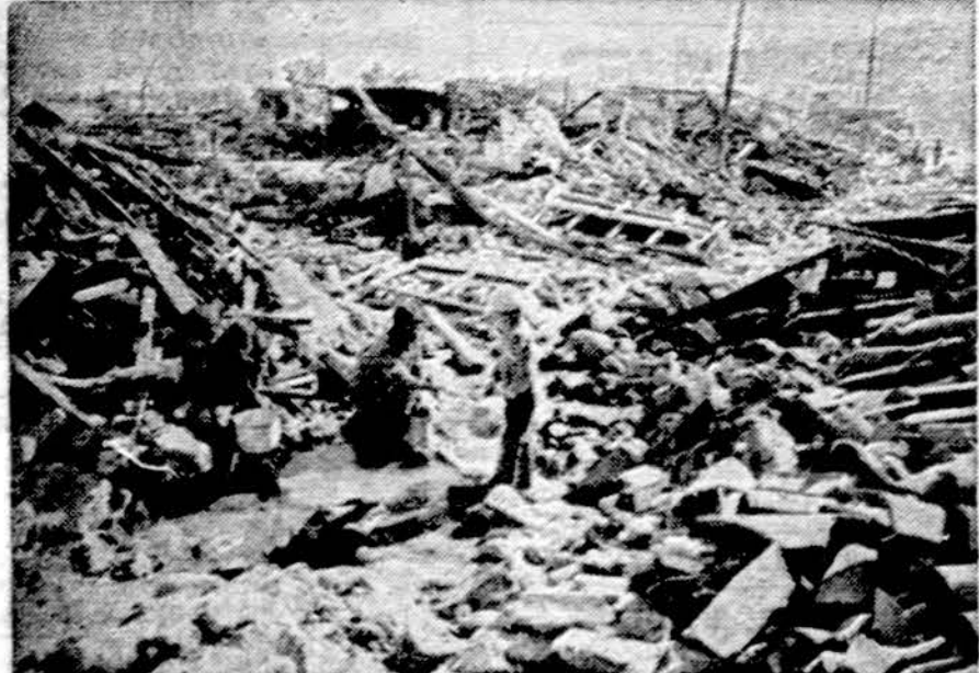
Vienas iš daugelio Guatemalos miestų po žemės drebėjimo

Daroma išvada, kad sovietų komunistinė partija yra pati pažėgiausia dvidešimtojo šimtmečio politinė organizacija, tik ji neleidžia kiekvienam individui eiti savo pasirinktu keliu, bet varu varo į vieną tikslą. Koks tas tikslas, visi žinome.