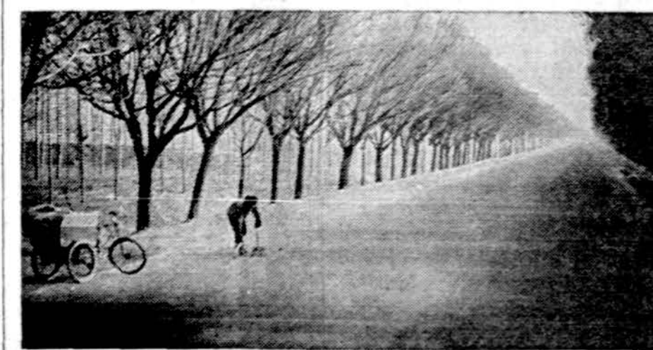
Kelias iš Pekino į aerodromą. Kai prieš 4 metus tuo keliu turėjo atvažiuoti prezidentas Nixonas, buvo sulaikytas judėjimas ir plentas rūpestingai išsiuotas. Nixonui iškantis antrą kartą, to nebuvo padaryta.

Albany. — New Yorko valstijos legislatura nubalsavo Concorde lėktuvams New Yorko miesto aerodrome neduoti leidimo nusileisti.