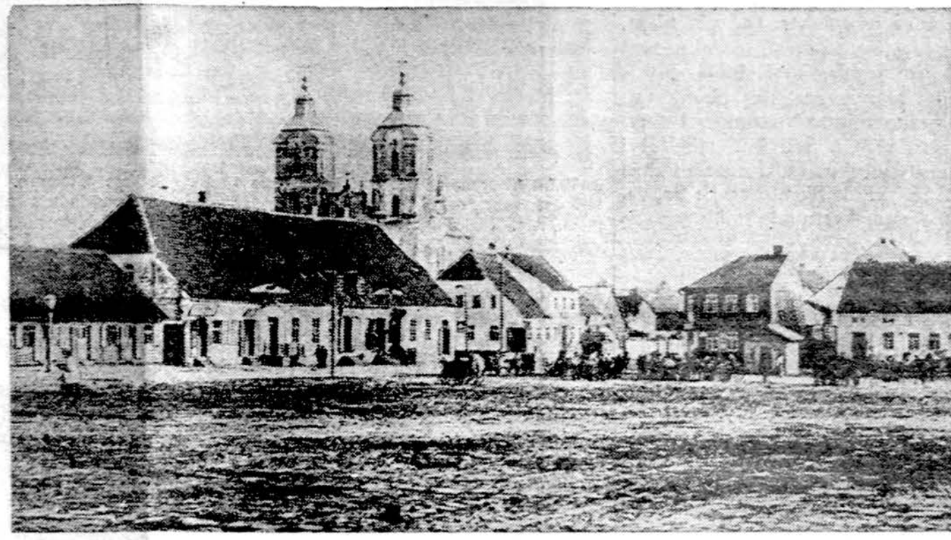
Kudirkos Naumiestis, Šakių apskr.

Vienintelė geresnė viltis, kad po metų ar kitų į Atlanto sąjungą gali įsijungti Ispanija. Iki šiol kiti sąjungininkai jos nenorėjo įleisti dėl nedemokratinio Franco režimo. Nėra abejonių, kad Ispanija karaliaus Juan Carlos sukama demokratiškai linkme.