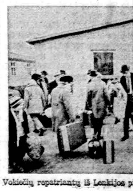
Vokiečių repatriantų iš Lenkijos pirmosios valandos Vakarų Vokietijoje

Washingtonas. — Šviesos taupymo laiką Senatąs nubalsavo pratęsti, vietoj šešių mėnesių padaryti septynis. Būtų įvesta nuo kovo 14 iki spalio 17. Neaišku tik, ką tuo reikalau pasakys Atstovų rūmai. Manoma, jog ten projektas gali nepraeiti.