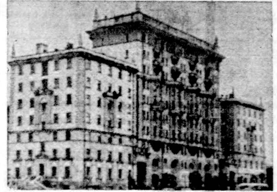
Amerikos ambasada Maskvoje. Šis pastatas pasidarė diskusijų objektu, kai amerikiečiai susekė, jog sovietai tam tikrais spinduliais peršviečia ir klausosi pasikalbėjimų, o sovietai peršviečia amerikiečių pasikalbėjimus.

Washingtonas. — Aukščiausiasis teismas išaiškino, kad valstijos turi teisę leisti potvarkių ir drausti dirbti nelegaliai atvykusiems užsieniečiams.