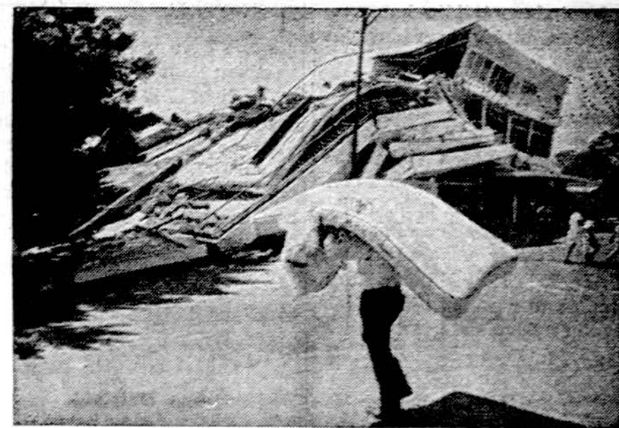
Po žemės drebėjimo Guatemaloje

New York. — Sovietų diplomatų rezidencija New Yorke, Bronxo dalyje, buvo apšaudyta, išbyrėjo langai. Niekas nenukentėjo. Paskui atsiliepė tam tikra žydų grupė ir sakė, kad tai buvo kerštas už nenorą iš Sovietijos išleisti jaunų vyrų, galinčių įstoti į Izraelio kariuomenę.