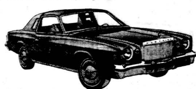
Cordoba 2-Door Hardtop

Atvykite pamatyti naują mažą Chrysler Cordoba ekonomiška iki 22 mylių galionu