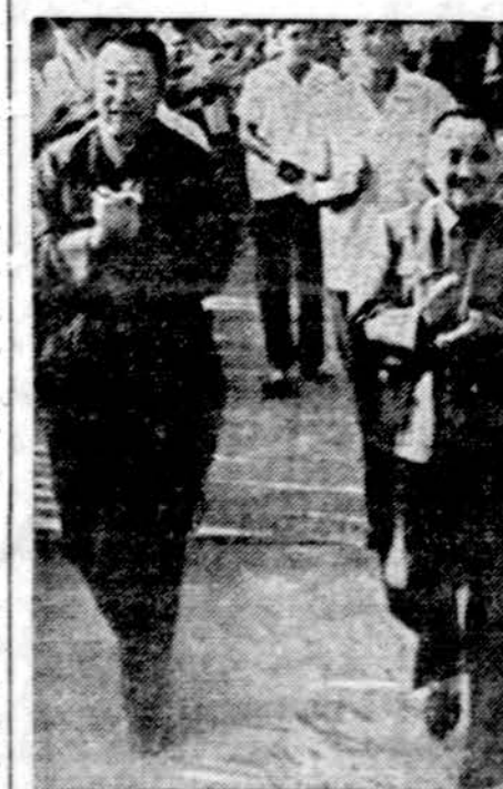
Dabartinis ir buvęs Kinijos premjerai. Hua Kuo-feng (k.) ir Teng Hsiao-ping vieną ankstesnę nuotrauką

Bostonas. — Baltųjų ir juodųjų mokinių apsimėtymas akmenimis ir muštynės šiame mieste dažnas reiškinys. Paskutinis toks atsitikimas buvo ketvirtadienį prie Gavin aukštesniosios mokyklos, kai aukštojo juodieji į baltųjų mokyklą.