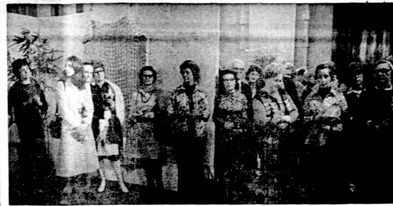
Gražus būrelis lietuvių ir kitataučių "Dvidešimt lietuvių dailininkų" parodos atidaryme Chicago miesto centrinėje bibliotekoje vasario 18 d.

× Weiss Travel Bureau, Inc. 4837 W. Irving Park Rd., Chicago, Ill. 60641 yra visada pasiruošęs suteikti reikiamas informacijas ruošiantis kelionei Amerikoje ar užsienyje. Teirautis apie papigintas grupines skraidas ir nuolaidas, kurias galima pritaikinti skrendant iš miesto į miestą ar į užsienį. Naujausias informacijas gausite pas R. Rastavičienę tel. (312) 545-6468. (sk.)