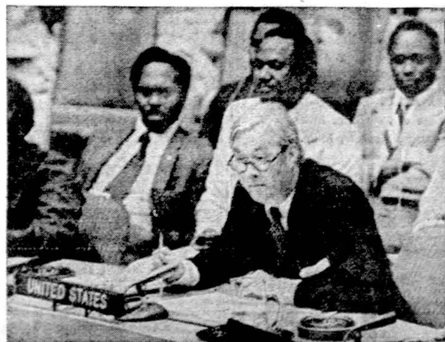
Daniel P. Moynihan, Amerikos ambasadoriaus Jungtinėse tautose, šandien paskutinė diena

New York. — Ambasadorius Daniel Moynihan, rotacine tvarka vasario mėnesį pirmininkavęs Jungtinių Tautų Saugumo Tarybai, šiandien savo pareigas pabaigė. Jo bendradarbiai surengė jam išleistuves, ir jis vaišė apibūdino savo veiklą: "Amerika laisvės pusėje. Mūsų atstovai labai dažnai tarptautiniuose forumuose bijo pasakyti pilną teisybę, tokią, kokią ir reikia pasakyti. Mes to nepabūgome. Teisybę sakyti yra šio krašto pareiga ir garbė". Apie savo įpėdinį, buvusį Pensilvanijos gubernatorių William Scrantoną, Moynihanas atsiliepė gražiai: "Puikus vyras, labai gerai informuotas ir didelis patriotas".