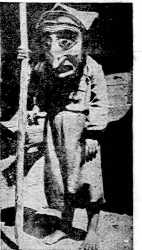
Užgavėnių kaukes mėgdavo anais laikais Lietuvos vaikai ir jomis gąsdindavo žmones.