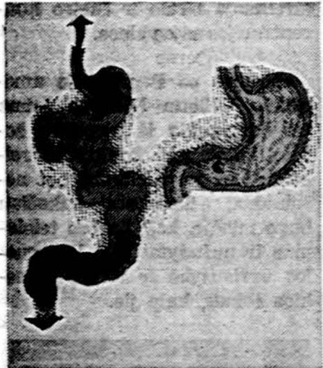
Schematiska atvaizduotas virškinimo kanalo kraujavimas — dėl žaizdos iš skrandžio ligonis vemia kraujais ir viduriuoja smalos pavidalo mase. Dešinėje: skrandis su prakiurusia sienele dėl žaizdos.

Daugelis gydytojų žino apie paciento įtampos sukeltas kraujojančias žaizdas. Kai kurie pacientai savo kailiu patiria tokias įtampos sukeltas skrandyje ir kitose virškinimo kanalo dalyse kraujojančias žaizdas už savaitės po apturėtų įtampos: dėl atliktos operacijos, dėl galvos sužeidimo, dėl apdegimo ar susirgus stipriu kraujo užkrėtimu (sepsis). Kai reikia tokius ligonius dėl kraujojančios žaizdos operuoti, ar, nelaimingu atsitikimu — kai jie mirtingai nukraujuoja, jų lavonus mediciniškai apžiūrint, randamas kraujavimo šaltinis: viena vienišė paviršinė žaizda, o kartais net kelios (multiple ulcers). Įtampa gali kartais atverti seną skrandžio ar