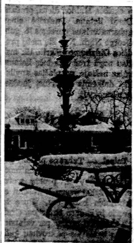
Lietuviška sodyba, laukdama pavasario, žiemos grožio gerina gyvenotojų nuotaikas.

Operacijos irgi gali sukelti įtampos žaizdas: širdies ir kraujagyslių operacijos; šlapimo takų ir moterų bei vyrų lyties organų