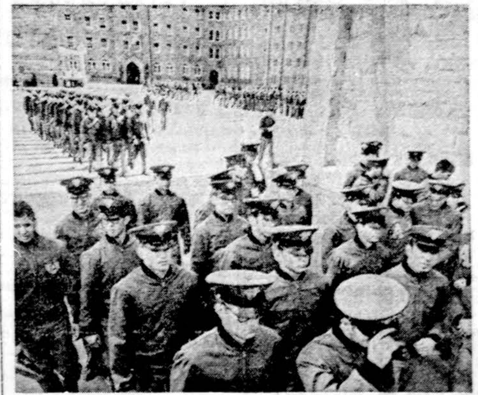
JAV kariūnai (kandidatai į karininkus) West Point karinėje akademijoje, jų karinio apmokymo metu.

Salisbury. — Rodezija vis dažniau susiduria su iš Mozambiko infiltruotais partizanais, ir paskutiniajam mūšy krito 24 partizanai ir 4 rodeziečiai