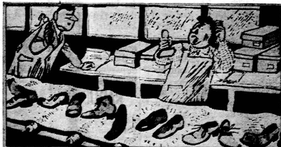
Sovietų "Krokodil" taip vaizduoja Sov. Rusijos batų pramonę. Ba-tai rūšiuojami, bet gerų batų tiek maža, kad vienas iš rūšiuotojų kla-usia, kur dinga antspaudėlis su įrašu "Pirmos rūšies", nes tokio antspau-do jie jau seniai nevartojo.

Partijos suvažiavime paskelbta daugelis sūkių, kurie bus vis mė-tomi ir per ateinantį penkmetį peršami: vykdyti planus, stiprin-ti Sovietų galybę, neklusiant, ką gaus pilietis už didžias savo pastangas.