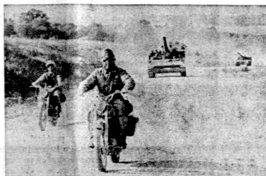
Vakarų Vokietijos kariuomenė Vakarų Europoje yra stipriausia. Jos privergia ir Sovietai, darydami spaudimą, kad V. Vokietija būtų "neutrizuota". Čia matome vieną artilerijos dalinį karinių manevrų metu.

Washingtonas. — Amerikoj patį nesaugiausia profesija yra ugniagesių. 1974 iš 100,000 vyrų žuvusių teko 84 asmenys, antroje vietoje pavojingiausia yra anglų kasėjų profesija, kur iš to paties skaičiaus darbininkų se laikraščiuose labai šiltai atsiliepė apie lietuvius, su kuriais jai teko susitikti lageriuose (E.)