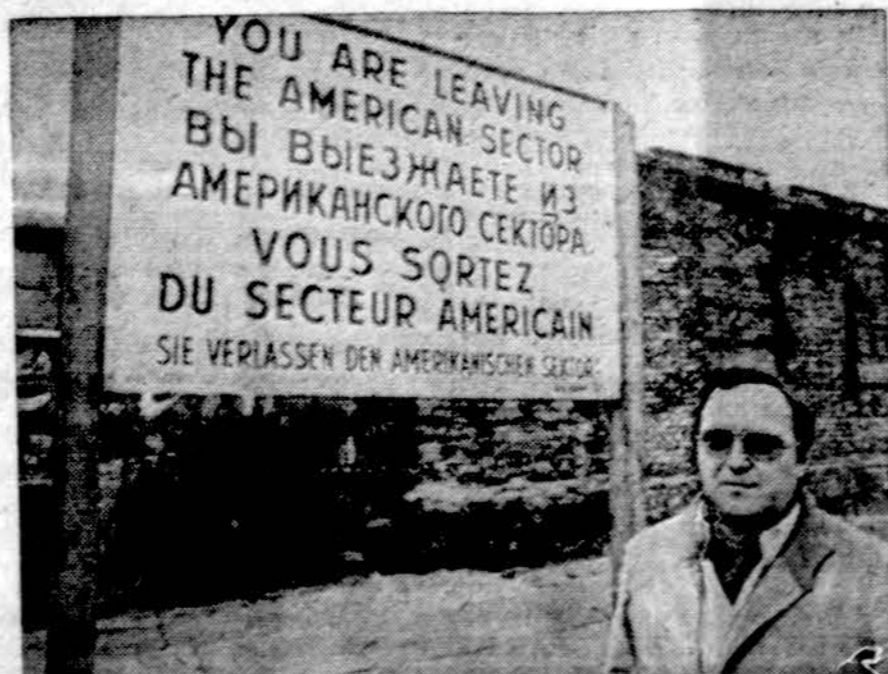
Berlyno gėdos siena

poetas Dantė, turi ypatingus giminytės ryšius su Dievu, tai menininkas turi nuolat trokšti kuo labiau prisitarti prie Dievo. Jį vis geriau pažinti ir vis tobuliau mylėti. Mene, kaip ir visose kitose žmogaus kūrybos srityse, reikia nuolat stengtis pakilti aukščiau".