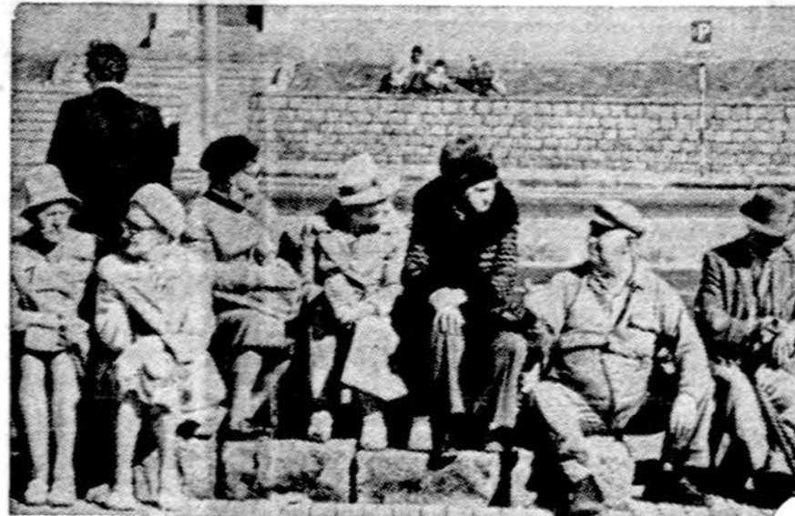
Islandijos pensininkai savo krašto sostinėje — Reykjavike

Airių aktyvistų atsakymas į britų karines ir politines priemo-nes buvo tas, kad sekančią die-ną jie Belfasto prekybinėje arka-joje išsprogdino bombą, užmuš-dami 4 ir sužeidami 14 asmenų.