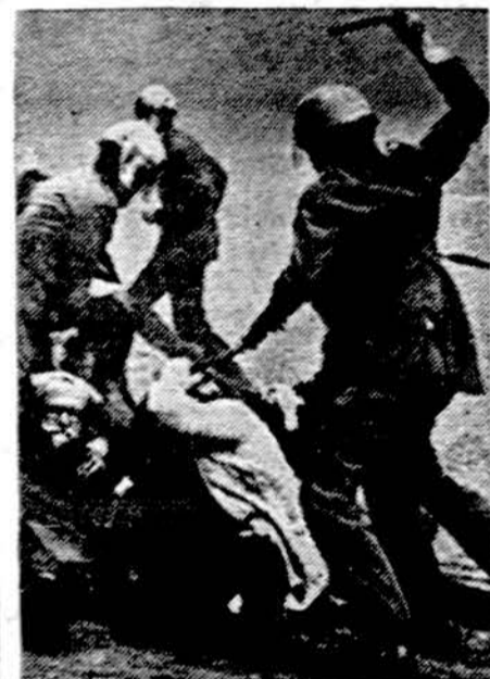
Ispanijoje malšinami demonstrantai