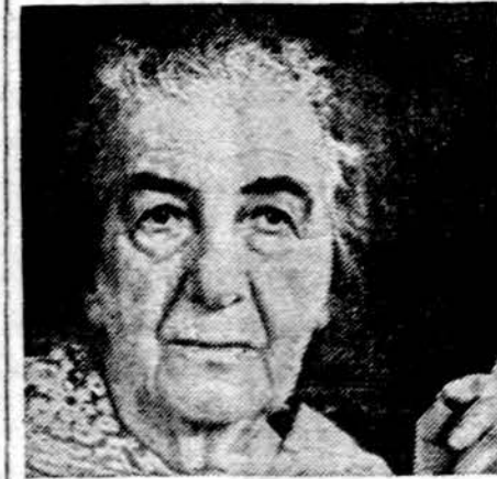
Buvusi Izraelio premjerė Golda Meir nebesireikšia politiniame gyvenime. Tačiau ji parašė 500 puslapių atsiminimų knygą, kuri yra įdomi ir mielai skaitoma.

Mozambikui ir Angolai gavus nepriklausomybę, Rodezija ir Pietų Afrikos respublika yra juodųjų valstybių apsuptos. Ypač pavojinga būklė Rodezijos, kur 270,000 baltųjų valdo 6 mil. juodųjų. Nemažiau Portugalijos pasitraukimo yra paliesta ir Pietų Afrikos respublika, kuri su Mozambiku ir Angola turėjo bendras sienas, ją skyrusias nuo juodųjų valstybių. Dabar būvis saugumo ji jau nebūti. Juodoji Afrika yra pasiryžusi visą žemyną išvaduoti iš baltųjų valdymo, išlikusio dar dviejose Afrikos žemyno srityse.