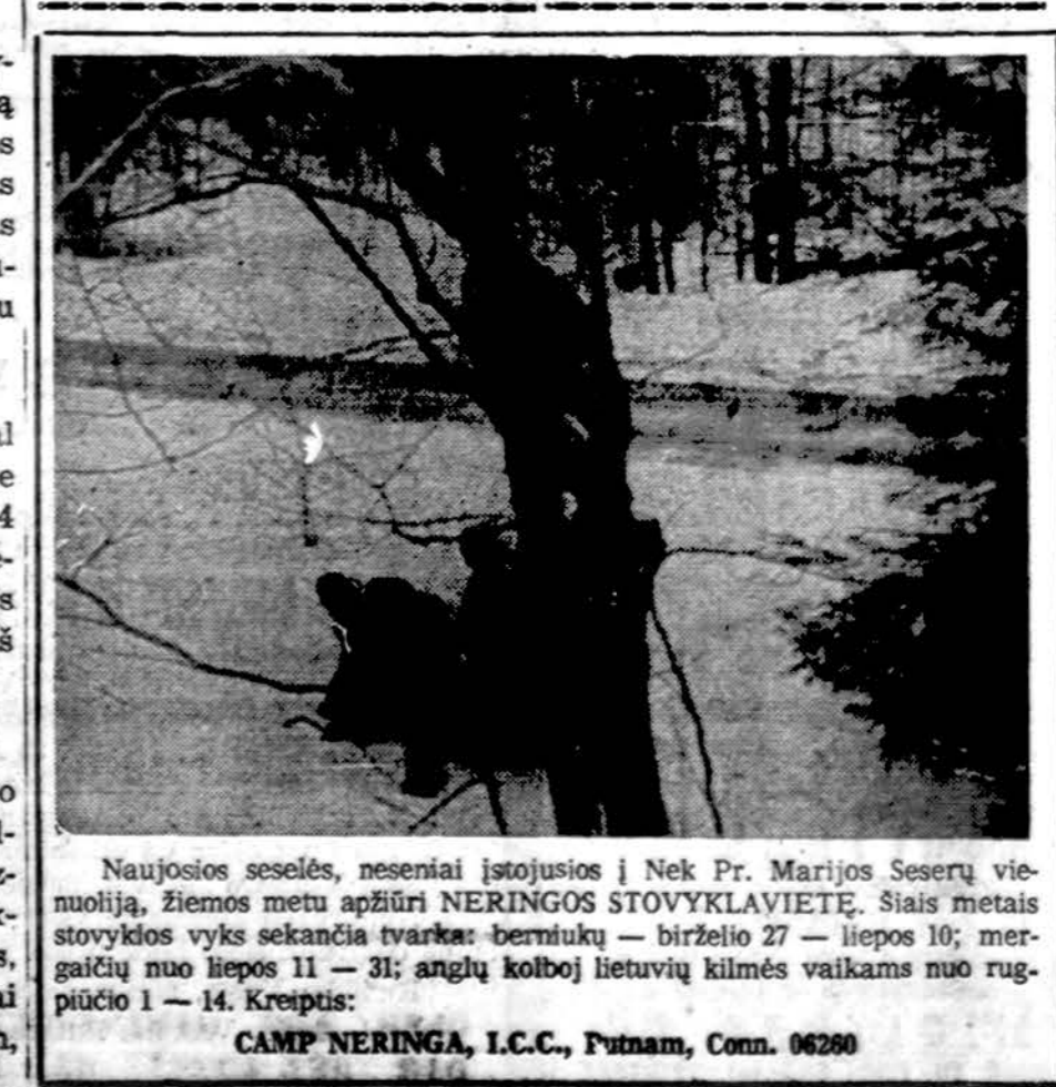
Naujosios seselės, neseniai įstojusios į Nek Pr. Marijos Seserų vienuoliją, žiemos metu apžiūri NERINGOS STOVYKLAVIETĘ. Šiais metais stovyklos vyks sekandą tvarka: bernukų — birželio 27 — liepos 10; mergaičių nuo liepos 11 — 31; anglių kolboji lietuvių kilmės vaikams nuo rugpjūčio 1 — 14. Kreiptis: CAMP NERINGA, I.C.C., Putnam, Conn. 06290

Illinois Arts Council ieško menininkų, kurie galėtų talkinti, vykdam programą vaizdinio meno, literatūros, rankdarbių, šokių, architektūros, muzikos srityse. Kandidatai turi kreiptis į Jane Turczyn, Illinois Arts Council.