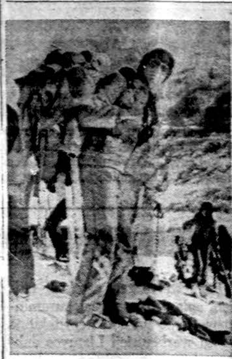
Vokiečių slidininkai Alpių kalnuose