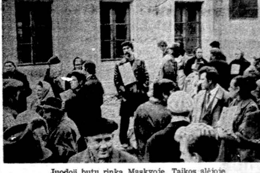
Juodoji butų rinka Maskvoje, Taikos alėjoje

Norvegijos vyriausybės užsienio reikalų politika vos juda ir tai labai atsargiai. Užs. reikalų min. Knut Frydenlund daugiausia bendrauja su Tarptautine energijos agentūra, išskodamas savo naftai ir dujoms naujų klientų ir dalyvaudamas NATO (Nukelta į 5 pusl.)