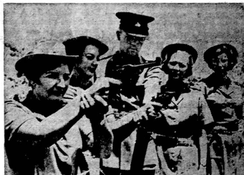
Rhodezijos baltieji gyventojai, turėdami prieš akis akivaizdų komuniz- mo pavojų, ruošiasi gintis. Į gynybą įsitraukia ir moterys. Čia matome vieną karininką, mokantį moteris šaudyti.

Washingtonas. — Viena Indijos parlamento nario žinio- mis, krašto pirm. Indira Gan- dhi dėl politinių priežasčių iš- santi įkalinusi 140,000 asmenų.