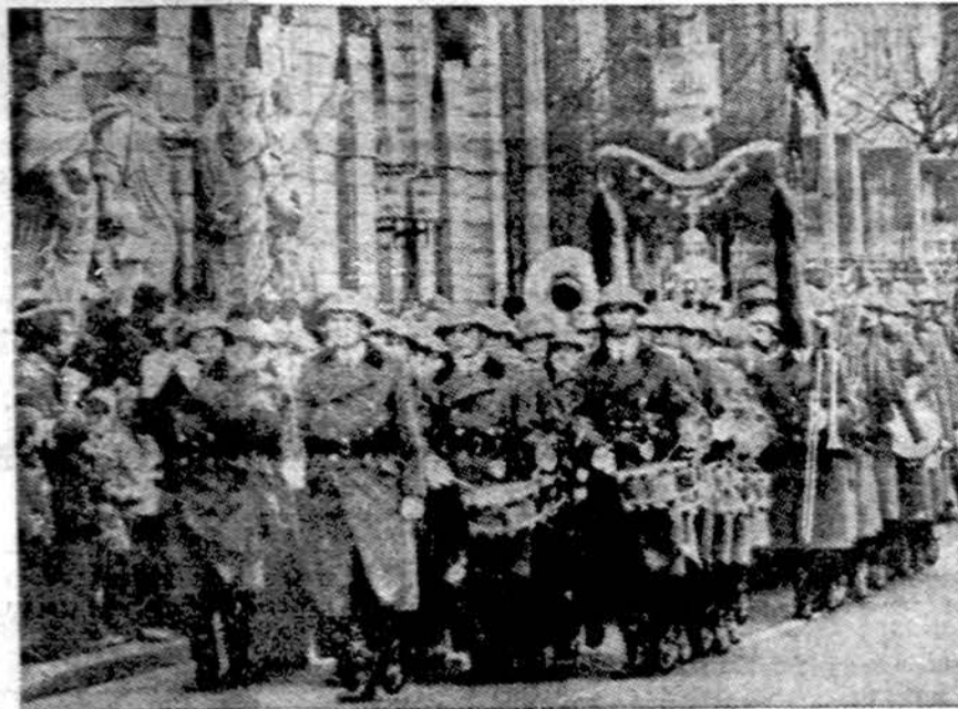
Sovietų kontroliuojama ir apmokama Rytų Vokietijos kariuomenė atšventė savo 20 metų sukaktį. Pagal naują sutartį su Sovietų Sąjunga, ji privalo ne tikti savo krašto, bet ir visų socialistinių valstybių sienas ginti. Čia matome vieną dalinį, paradojuojantį Rytinio Berlyno gatvėse.

Washingtonas. — Atomo reguliavimo komisija praneša, kad nuo 1969 m. jau gavo net 100 grasinimų susprogdinti atomines jėgaines. Dinamito buvo rasta Point Beach atominėje jėgainėje Wisconsin, penki mėnesiai prieš žmonės paleidimą, kuri paleista 1970 m. Apie visus pasikėsinimus ir grasinimus informuojama FBI.