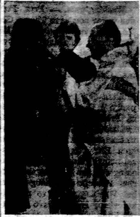
Šv. Komunija ateitininkų Žiemos kursų metu Dainavoje.

Konkurso premijoms pinigų jau atsuntė ar pažadėjo: Gajos korporacijos centro valdyba —