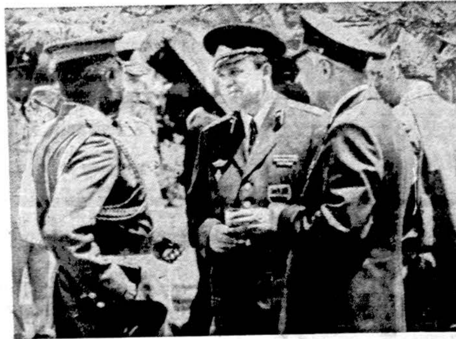
Sovietai energingai veržiasi į Afrikos kraštus. Vienus jų jau užėmė, kitus ruošiasi užimti. Čia matome Sovietų karininkus Ugandoje, besikalbančius su vietiniais karininkais, kuriems Sovietai duoda įvairių rūšių ginklus ir "patarimus".

Madridas. — Ispanijos vyriausybė sutiko pratęsti trims ar penkiems metams Radijo Free Europe transliacijas į Sovietų Rusiją iš Ispanijos. Buvo skelbiama, kad sutartis bus nutraukta, tačiau užsienio reikalų min. Jose de Areliza pareiškė, kad sutartis po pasitarimo su trimis stoties pareigūnais ir JA Valstybių ambasadoriumi Stabeler, bus atnaujinta. Spaudimam nutraukti sutartį buvo daromas iš Sovietų, ypač kai Ispanija nori atnaujinti diplomatinis ryšius su Maskva.