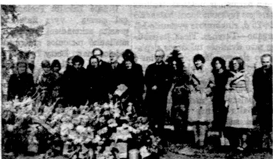
Prie a. a. S. Nasvyčio kapo Clevelande. Matyti Augustinavičiai, Smeto- nai, Nasvyčiai ir kiti artimieji.

Jam linkime geriausios svei- katos, o jo labai idomius straips- nius iš Australijos sportinio gy- venimo patalpinsime sekantį kartą.