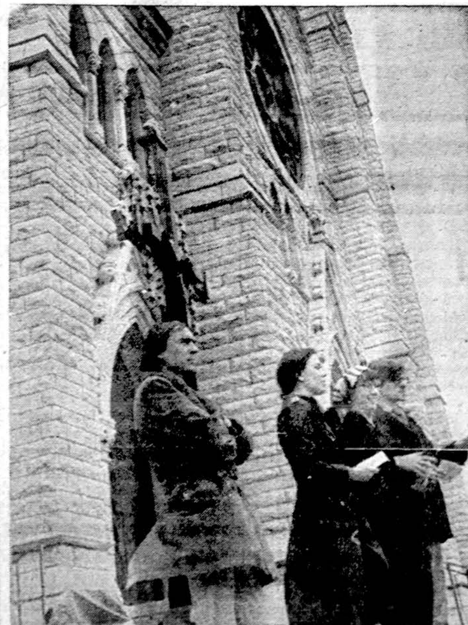
Lietuviai studentai ir Poskočimo išdrožtas kryžius prie Chicago katedros sekmadienio rytą, tik išaušus. Studentai pasikeisdami išbūdėjo 40 valandų be pertraukos, vieni skaitė "Lietuvių Katalikų Bažnyčios Kroniką", kiti praėviams dalino lapelius apie Lietuvos tikinčiųjų kančias.