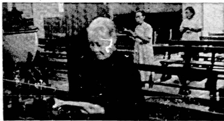
Viena iš nedaugelio krikščionių bažnyčių Kinijoje, dar veikusių pirmaisiais komunistų valdymo metais, bet jų lankymas ir tada buvo labai rizikingas. Krikščionys ir ten suėjo į katakombas

Toliau laisvosios Kinijos arkivyskupas sakė, kad katalikų skaičius Taiwane žymiai padidėjo. Pavyzdžiui po 1950 metų katalikų skaičius nuo 12,000 pakilo iki 300 tūkstančių, kuriuos aptarnauja 800 kunigų.