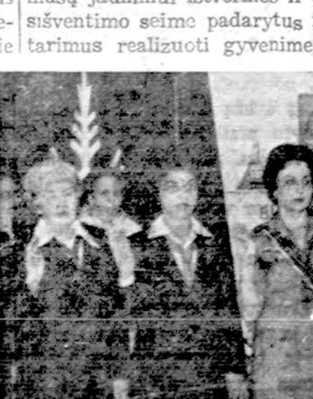
Clevelando skautininkės savo sueigos metu gieda Lietuvos himną.

atstatyti". Mano laiško esminė paskirtis yra ieškoti kelio Bendruomenėje vienybei atstatyti. Laiško pradžioje minėjau, kad nesantaika neišsprendžiama, kad lietuvių, Lietuvos Bendruomenės idėjos ir organizacijos atžvilgiu. St. Barzdukas, komentuodamas mano pasiūlymus, vieniemis pritarė, prieš kitus pasisakydamas prieš, esmėje pritaria, kad mano laiškas tuo reikalu sudaro sąlygas pokalbiui. Pokalbis reikia pradėti ir jį reikia pradėti tautinės gyvybės išlaikymui užtikrinti, kad visi lietuvių teltųsi Lietuvos Bendruomenėje, kuriai daugelis aukojosi ir dirbo, apie kurią daug kalbėjome ir rašėme ir kurios būtinumu ir ateitimi tikėjome ir tikime.