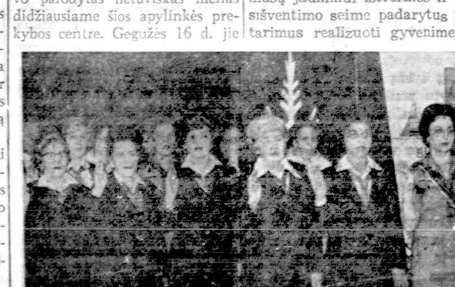
Clevelando skautininkės savo sueigos metu gieda Lietuvos himną.

atstatyti". Mano laiško esminė paskirtis yra ieškoti kelio Bendruomenėje vienybei atstatyti. Laiško pradžioje minėjau, kad nesantaika neišsprendžiama, kad lietuvių, Lietuvos Bendruomenės idėjos ir organizacijos atžvilgiu. St. Barzdukas, komentuodamas mano pasiūlymus, vieniemis pritarė, prieš kitus pasisakydamas prieš, esmėje pritaria, kad mano laiškas tuo reikalu sudaro sąlygas pokalbiui. Pokalbis reikia pradėti ir jį reikia pradėti tautinės gyvybės išlaikymui užtikrinti, kad visi lietuvių teltųsi Lietuvos Bendruomenėje, kuriai daugelis aukojosi ir dirbo, apie kurią daug kalbėjome ir rašėme ir kurios būtinumu ir ateitimi tikėjome ir tikime.