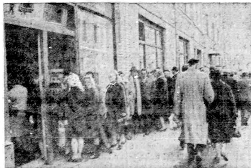
Įprastas vaizdas Maskvoje ir kituose Sovietijos miestuose — eilutės prie prekybos

Paryžiuje leidžiamas žurnalas „Esprit“ kovo numerį paskelbė Tomo Venclovos atvirą laišką, kuriuo prašo jam leisti emigruoti. (E.)