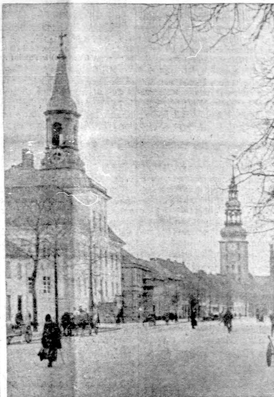
Tilzė, Mažosios Lietuvos buv. kultūrinis centras prieš I pasaulinį karą.

„Pravda“ dar iš anksto ėmė pranašauti, kad Kissingerio vizitas yra „apsaugoti Amerikos investuotą kapitalą, 3 bil. dolerių į rasistinius Rodezijos ir Pietų Afrikos kraštus“. Pranašauja, kad niekas neišgelbės Amerikos, jos laimė Afrikos kraštuose jau palaidota. „Tik viena Sovietų Sąjunga yra tikra gynėja išlaisvinimo judėjimo iš kolonializmo likučių“, sako laikraštis.