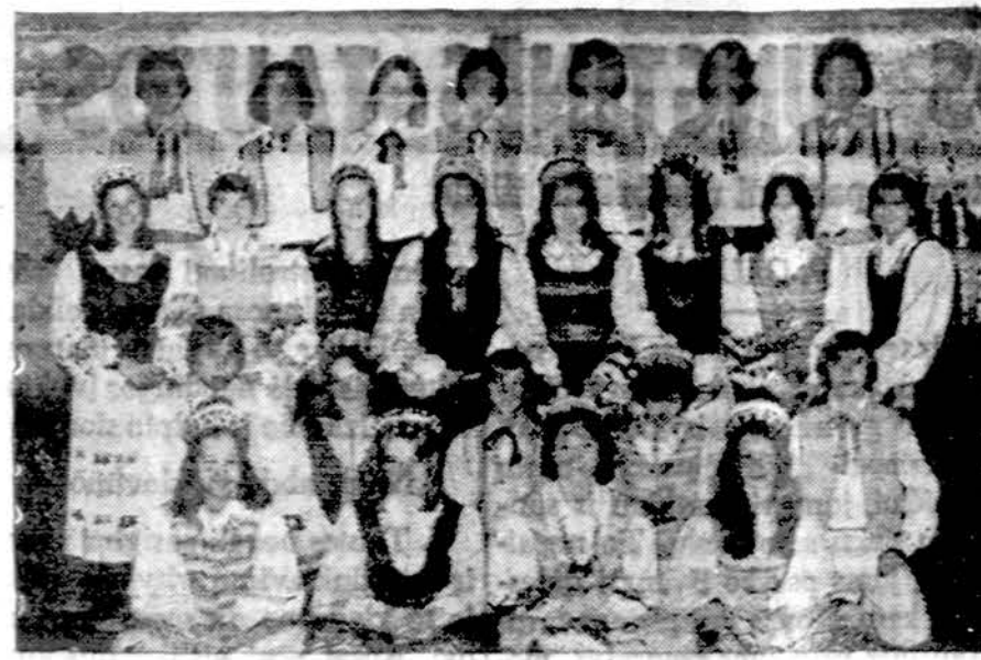
Baltimorės "Kalvelio" tautinių šokių grupė