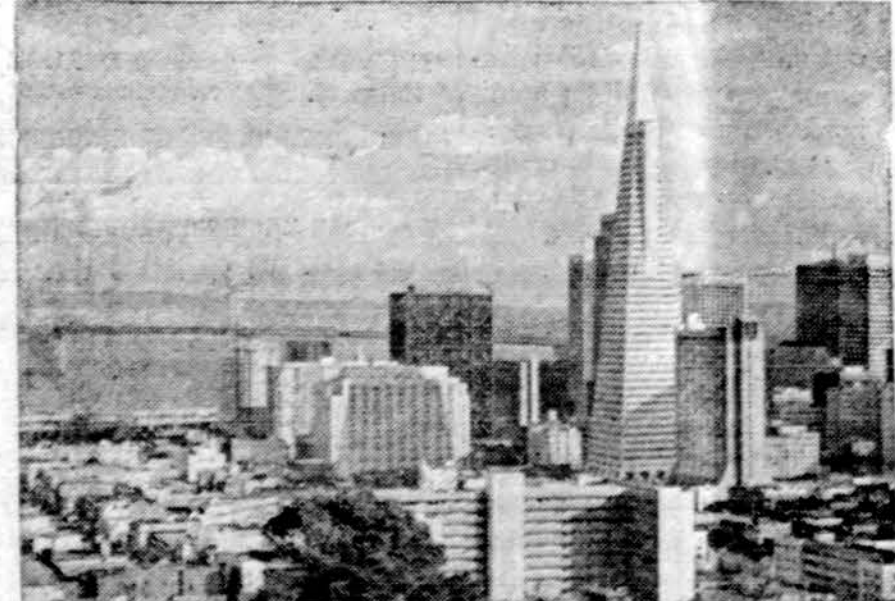
San Francisco, Calif., miesto vaizdas nuo Russian Hill kalvos.

San Francisco. — Vakaru turėjo baigtis San Francisco tarnautojų streikas, trukęs 33 dienas, sukaustęs miesto gyvenimą, šešios darbininkų ir tarnautojų unijos turėjo vakare susirinkti ir patvirtinti sudarytą kontraktą su miesto valdyba.